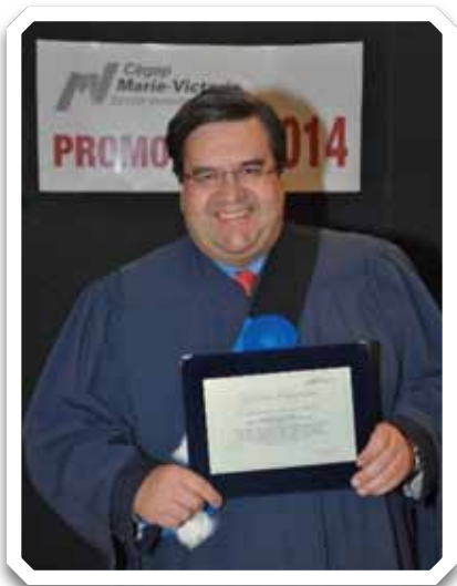
M. Denis Coderre, diplômé de Marie-Victorin, récipiendaire d'un diplôme honorifique afin de souligner son engagement ainsi que son apport à la communauté.

Chaque année, le Cégep décerne un diplôme honorifique à un ancien de Marie-Victorin afin de souligner son engagement ainsi que son apport à la communauté. C'est M. Denis Coderre, maire de Montréal, qui a mérité les grands honneurs cette année.