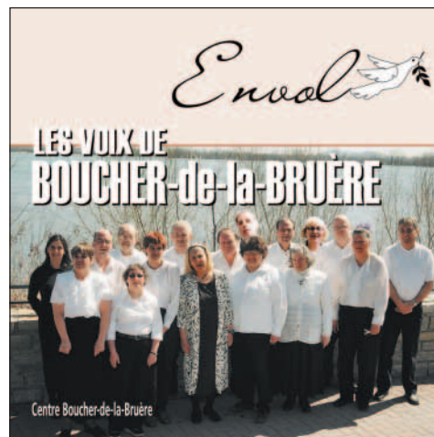
Le CD «Les Voix de Boucher-de-la-Bruère», vendu 10$ au kiosque Loto-Québec de la Fondation HLHL.