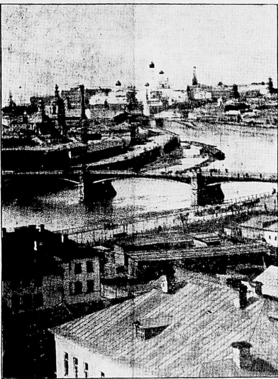
Vue magnifique de Moscou, capitale de la Russie soviétique. Située presque au centre du pays, la ville de Moscou, surnommée par les paysans "la petite mère", occupe les deux rives de la Moskova et toutes les grandes artères de la capitale russe aboutissent au Kremlin que l'on aperçoit à l'arrière-plan. Un des plus grands centres industriels de l'Union soviétique, Moscou est l'objectif principal de la grande offensive allemande.