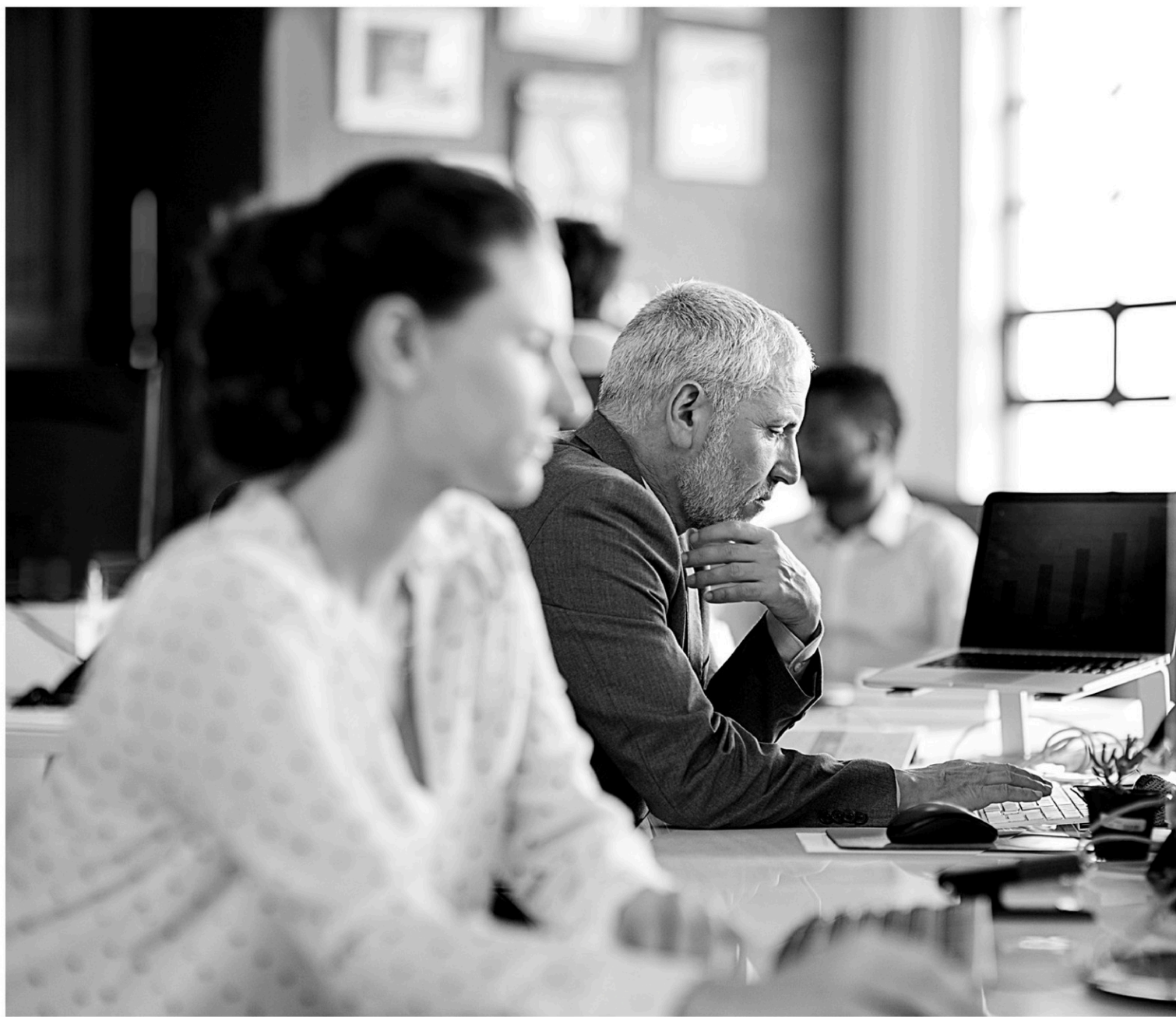
Les gens qui sont privés de connaissances de base éprouvent des problèmes accrus dans leur travail et dans l'exercice de leur quotidien.