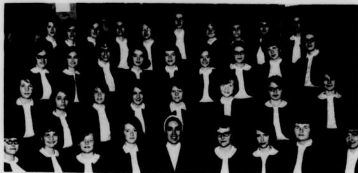
La chorale Coeur-Joie de Drummond.

La chorale Coeur-Joie de Drummond, au Nouveau-Brunswick, sera invitée à l'émission radiophonique Chorales acadiennes , le samedi 19 août à 18 h 15.