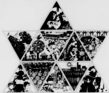
Un des éléments du kiosque de Radio-Canada au 20 e congrès de l'Association canadienne des éducateurs de langue française

L'Association canadienne des éducateurs de langue française tiendra son congrès annuel au Château Laurier, à Ottawa, du 21 au 25 août.