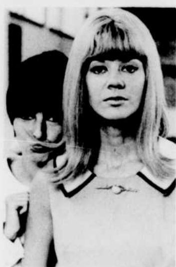
DODO et DENISE participeront à un quiz, le mardi 22 août à 21 h 30.