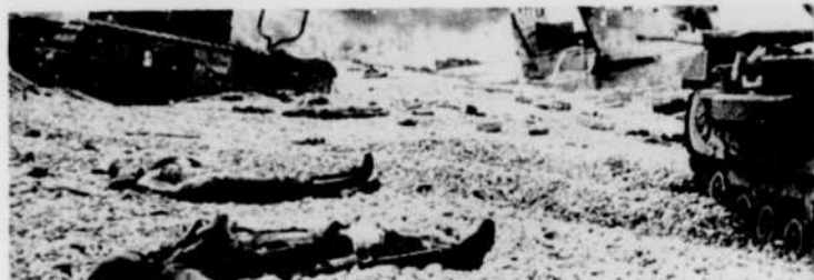
La plage de Dieppe après le départ des Canadiens

Le 19 août 1942, en plein coeur de la terrible deuxième guerre mondiale, avait lieu à Dieppe, sur les côtes françaises, un débarquement allié d'une importance extrême. Ce raid sur Dieppe, selon l'avis même de Churchill, constituait «un prélude indispensable à des opérations d'envergure contre le continent». Seule une telle épreuve de force pouvait permettre de mesurer l'efficacité de la technique et de l'équipement d'attaque contre les Allemands.