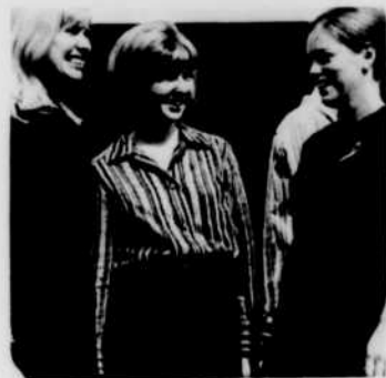
Les jolies hôtes de la Scandinavie

Par monts et par vaux se balade à l'Expo, cet été. Le réalisateur et animateur de cette émission radiophonique, Paul Legendre, rencontre pour les auditeurs de Radio-Canada des jeunes de tous les pays où l'on parle français.