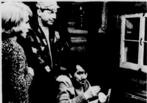
Micheline Presle, Claude Blanchard et Daniel Gélín

Le lundi 21 août à 21 h 30 et le lundi 28 août à la même heure, les téléspectateurs de Radio-Canada pourront voir les Saintes Chéries au Québec.