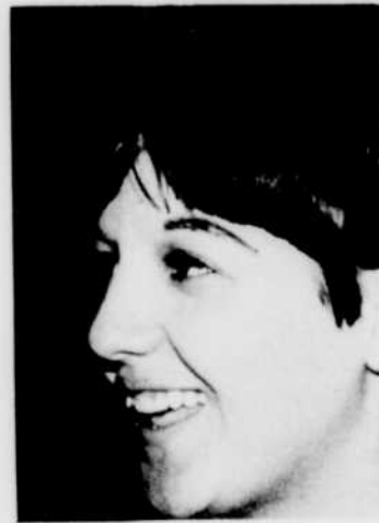
EDITH BUTLER et ANGÈLE ARSENAULT, vedettes de l'émission «Au chant de l'alouette», à la radio, chaque lundi à 20 h 15.