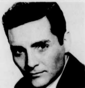
DAVID HEDISON, vedette de la série d'espionnage «La Main dans l'ombre», à la télévision, le vendredi à 15 heures.