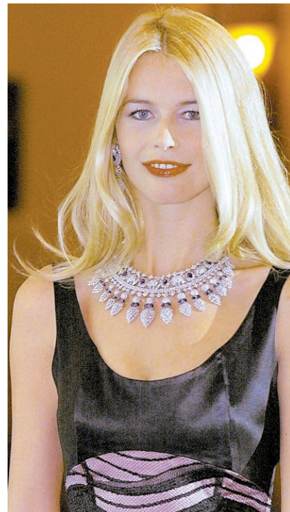
Le mannequin vedette Claudia Schiffer aime bien griller un cigare de temps à autre.

Jusqu'à là, la femme n'était que l'image blonde ou brune, une avenante expression au service de la symbolique masculine du cigare. George Sand et Colette avaient pourtant fait la révolution. Or, avec ce boom des années 90, d'autres femmes se sont emparées du cigare et l'ont façonné à leur image. Actrices et top modèles affichent à la une des magazines leur passion du barreau de chaise. Demi Moore, Gina Gershon, Claudia Schiffer ou Linda Evangelista — se voulant également les héritières des précurseuses de la Belle Époque, Greta Garbo, Bette Davis et Marlene Dietrich —, n'hésitent pas à révéler les secrets de leur premier cigare. Elle évoquent cette passion en termes de célébration. Variation sur les