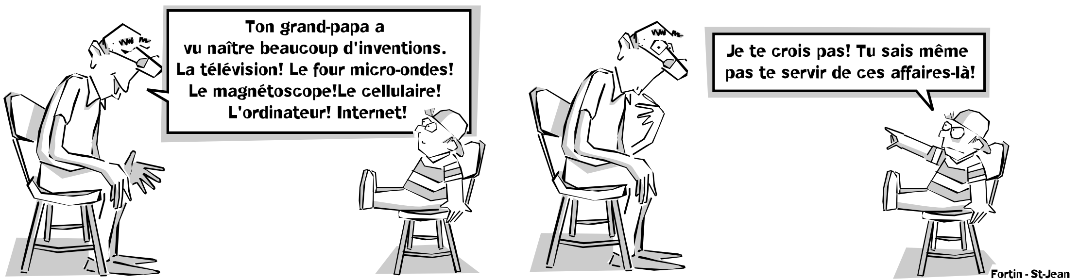
Fortin - St-Jean