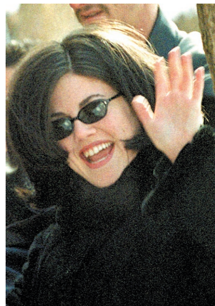
Bill Clinton a exploité la métaphore sexuelle du barreau de chaise dans l'épisode du « Monicagate ».

Aujourd'hui encore, d'autres femmes dépassent les frontières des cigar bars pour investir le monde de la production. À Cuba, Emilia Tamyayo est la première femme gérante d'une des plus grandes manufactures (El Laguito) de puros. Un peu partout aux États-Unis, des femmes sont propriétaires de boutiques de cigares, ces chasses gardées du sexe fort.