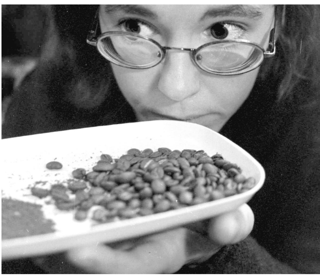
L'équipe de goûteurs Millstone Personal Blends a lancé l'idée d'offrir du café personnalisé.

Au salon Tissu Premier, la France reste le pays le plus représenté avec 194 tisseurs, suivie de l'Italie (68) et de l'Espagne.