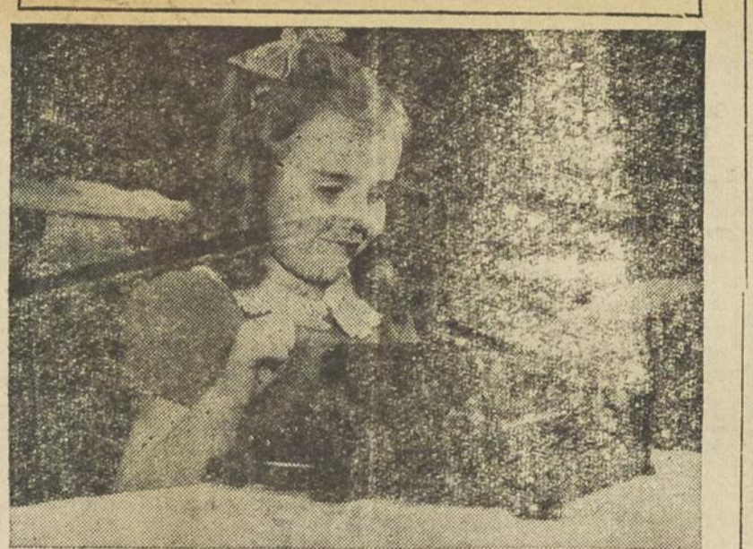
Cette gentille enfant se prête bien à une photo à éclair libre. On peut recourir à l'éclair libre avec la camera la plus rudimentaire pour les photos intérieures.

L'éclair à la Portée de Tous UN de mes amis déplorait, il n'y a pas longtemps, la pénurie des cameras, “munies d'un obturateur à éclair synchronisé pour prendre des photos à l'intérieur.”