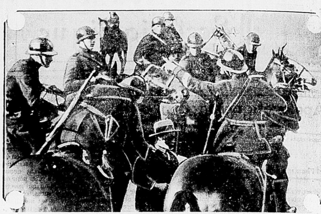
La police montée faisant une arrestation pendant une échauffourée communiste.