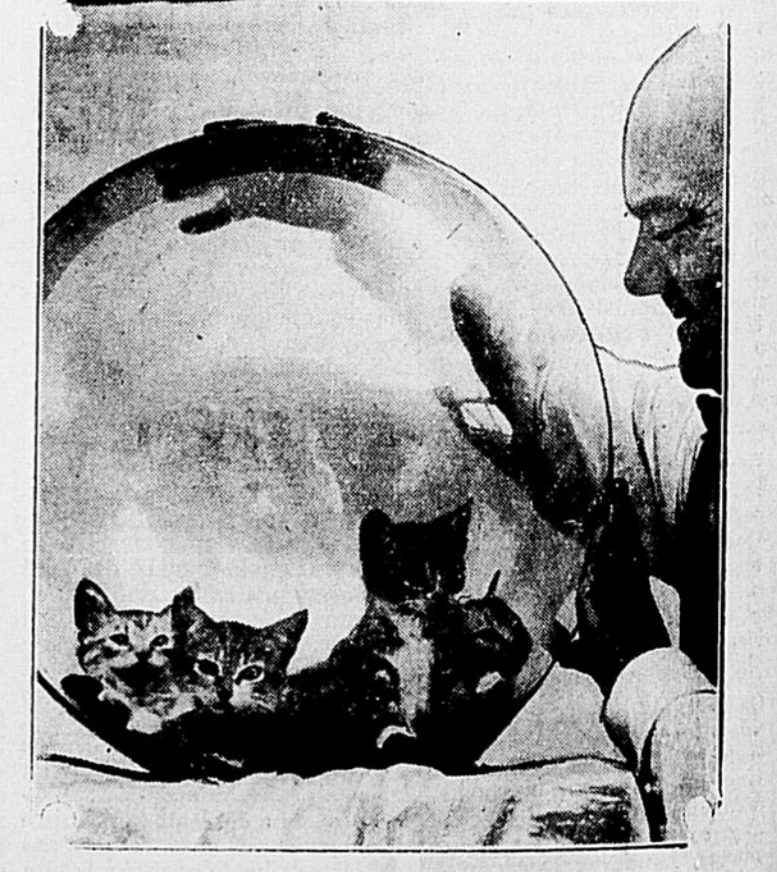
Une jolie petite nichée.