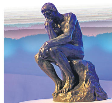
Le penseur de Rodin