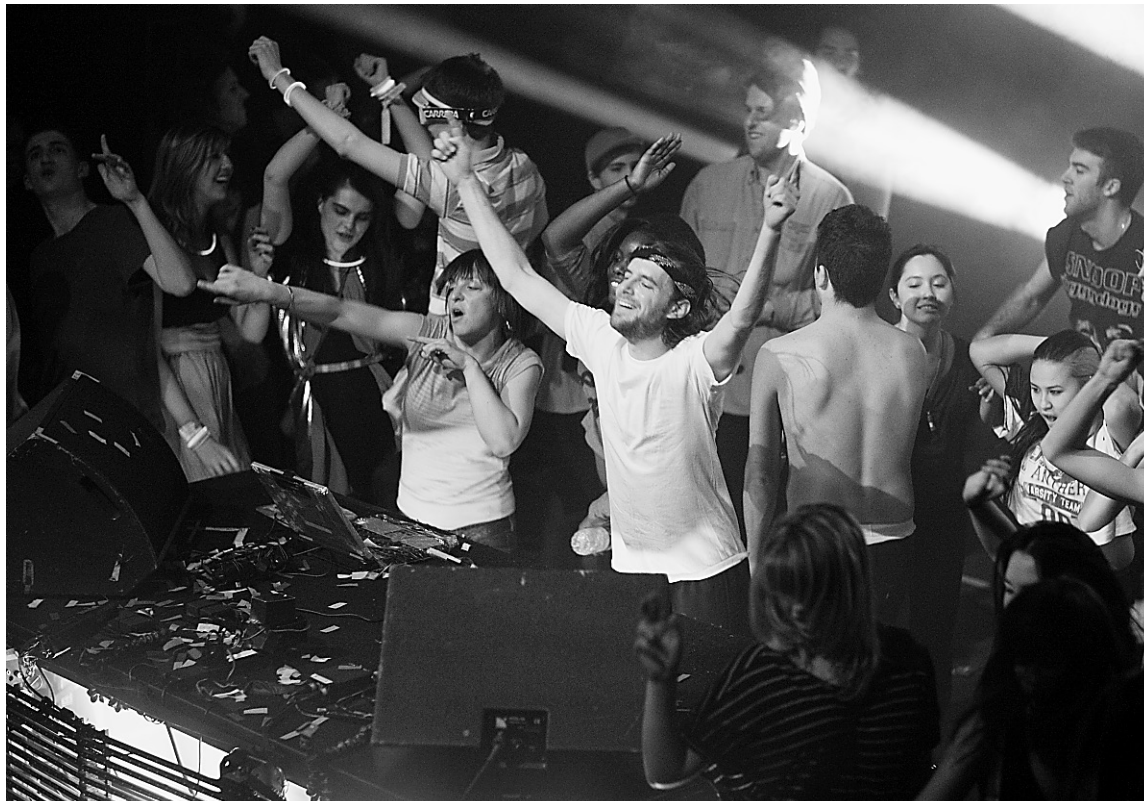
Le public de cégépiens et de jeunes universitaires s'en est donné à coeur joie, dansant et suant à grosses gouttes sans se soucier du lendemain tout au long des 90 minutes du spectacle de Girl Talk.

Et ça marche comme le truc n'avait jamais autant marché auparavant. D'ailleurs, Girl Talk n'en était pas à ses premières frasques à Montréal: il avait préalablement déjà rempli le Métropolis et sa mémorable performance au Club Soda, dans le cadre du Festival de jazz en 2007, s'était terminée sur le trottoir avec ses haut-parleurs sur les épaules. L'émeute, ou presque, un moment d'anthologie s'il en est un.