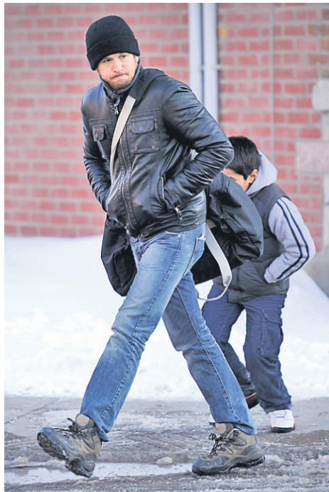
Le comédien Français Guillaume Canet tourne le film Une vie meilleure.