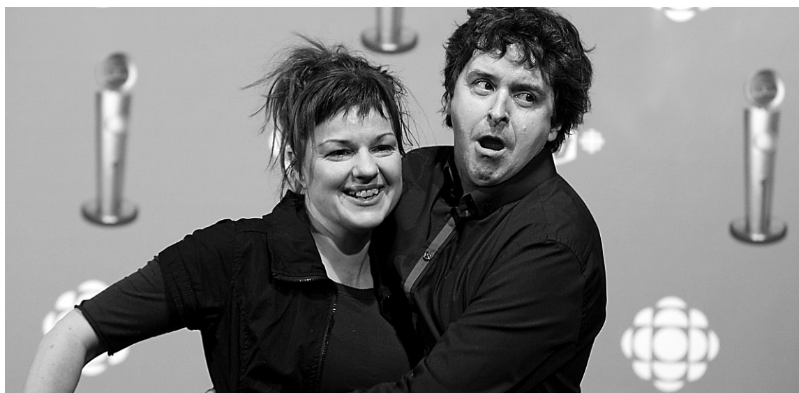
Sylvie Moreau et Yves Pelletier animeront la Soirée des Jutra le 13 mars à Radio-Canada.

Sylvie Moreau, qui pilote les Jutra pour la quatrième fois, s'est dite une grande fan de l'oeuvre de son coanimateur-cinéaste. «J'ai vu tous ses deux films», ricane-t-elle. «Toi, tu es