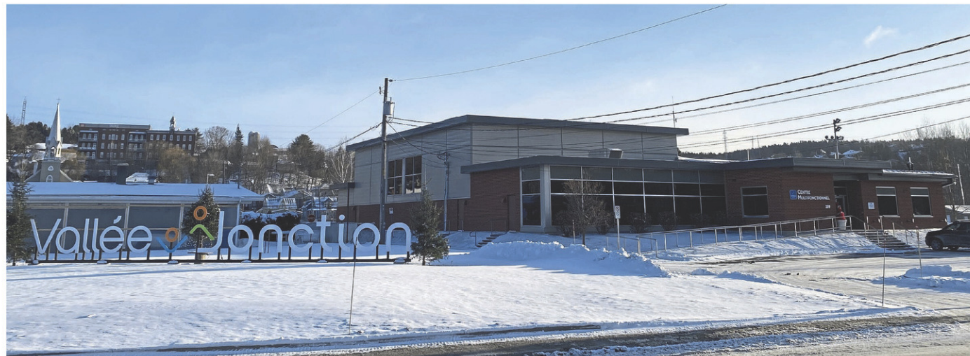
La municipalité de Vallée-Jonction a adopté un budget de 3,8 M$ pour l'année 2025.

Les dépenses seront l'hygiène du milieu, 753 300 $; le transport, 706 500 $; l'administration générale, 676 500 $; les loisirs et culture, 539 700 $; la sécurité publique, 364 600 $; les affectations, 351 500 $; les frais de financement, 161 900 $; le projet d'aménagement résilient, 150 000 $; l'aménagement, urbanisme et développement, 125 000 $; et la santé et bien-être, 9500 $. Le total des dépenses sera de 3 838 500 $.