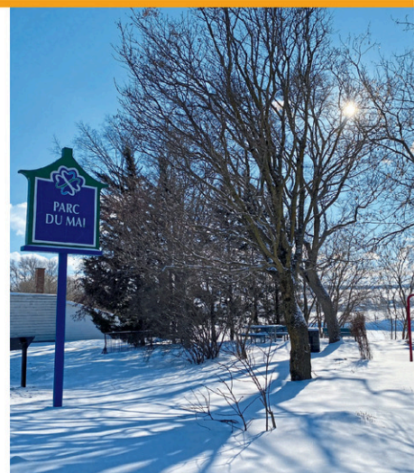
Le Parc du Mai, à Sainte-Marie, est finaliste pour le titre Toponyme coup de foudre 2025.

La Commission de toponymie vous invite à voter pour votre Toponyme coup de foudre 2025. Vous n'avez qu'à choisir l'un des 12 noms