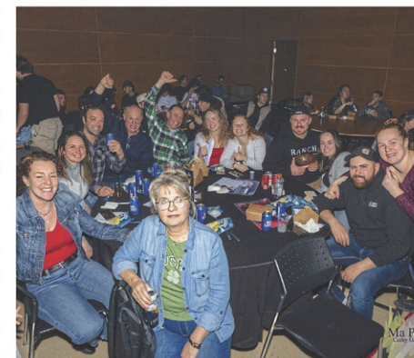
Souvenir de l'an dernier.

Mentionnons que la 59 e édition du Super Bowl opposera les Bills de Buffalo aux Chiefs de Kansas City. Le match se déroulera au Caesars Superdome de La Nouvelle-Orléans (Louisiane). Cette année, le spectacle de la mi-temps sera assuré par le rappeur américain Kendrick Lamar.