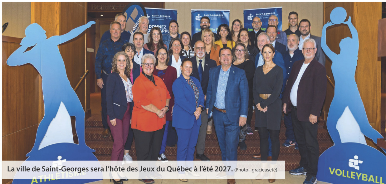
La ville de Saint-Georges sera l'hôte des Jeux du Québec à l'été 2027.

L'appui de la population a aussi joué un rôle prépondérant. Près de 7000 personnes ont signé un formulaire électronique ou apposé leur signature sur des bannières pour appuyer la ville et déjà plus de 1000 personnes ont démontré leur intérêt à être bénévole.