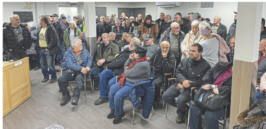
Plus de 125 personnes étaient présentes, le 23 janvier, lors de la séance extraordinaire du conseil municipal de Tring-Jonction.

Pour ce faire, les critères suivants s'appliqueront pour obtenir l'échantillon: les immeubles résidentiels de quatre logements et plus existants desservis par les services municipaux; les nouvelles constructions de résidences desservies par les services municipaux; et les résidences desservies par les services municipaux qui auront un projet de rénovation nécessitant