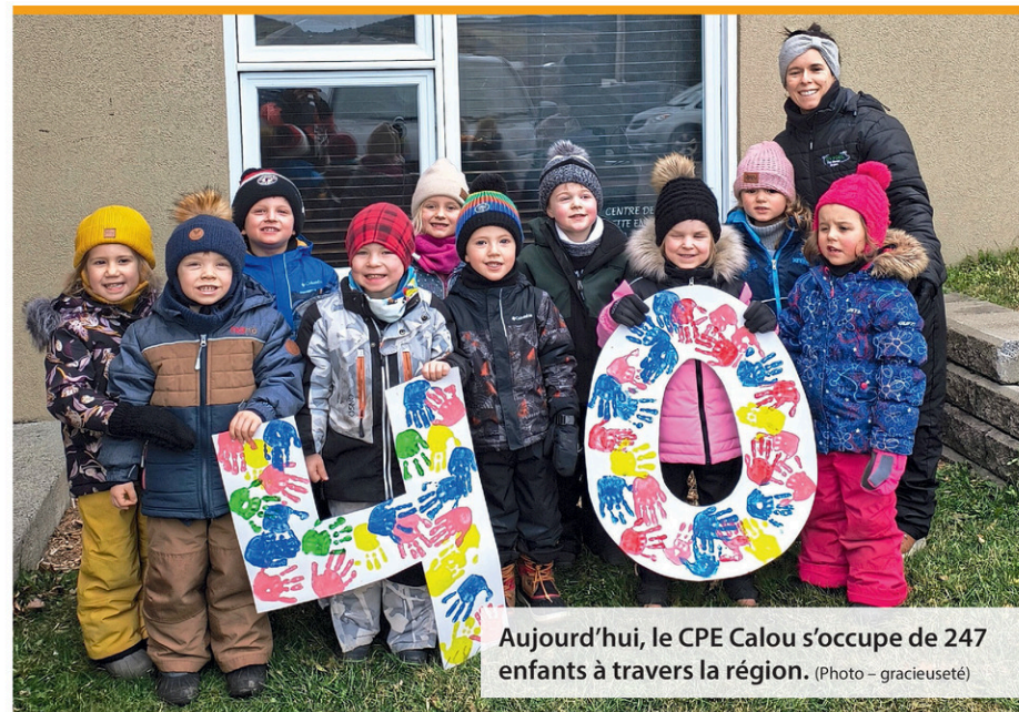
Aujourd'hui, le CPE Calou s'occupe de 247 enfants à travers la région.