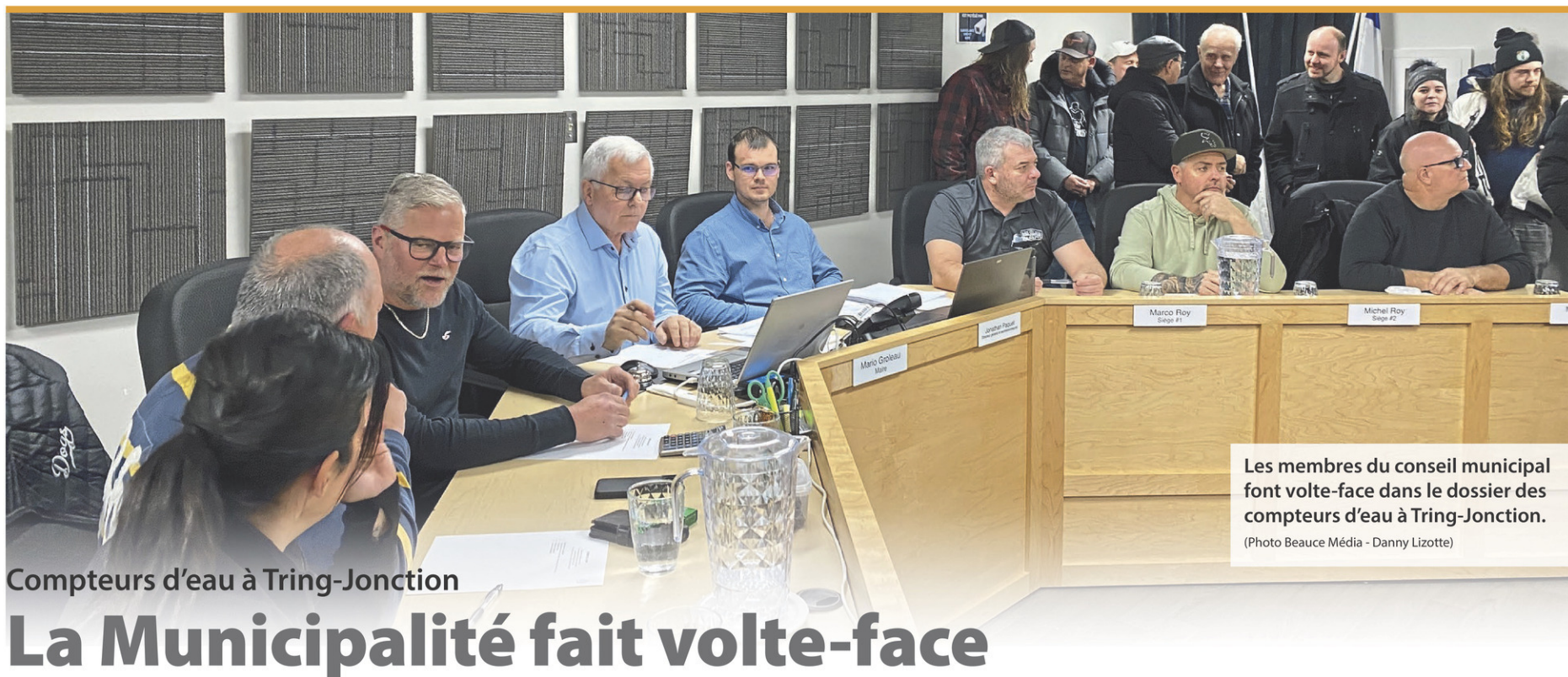
Les membres du conseil municipal font volte-face dans le dossier des compteurs d'eau à Tring-Jonction.