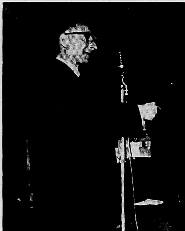
Réal Caouette parlait...