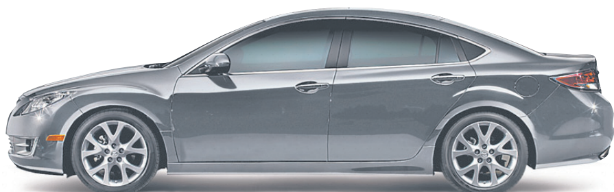
Modèle GT-V6 illustré