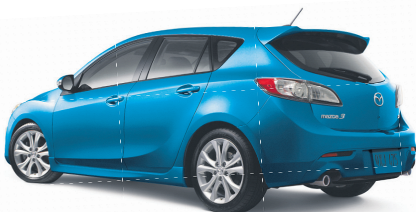
Modèle GT illustré

VOITURE DE TOURISME LA PLUS VENDUE AU CANADA EN 2010 †