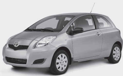
YARIS HATCHBACK 2010

0$ DÉPÔT DE SÉCURITÉ TRANSPORT ET PRÉPARATION INCLUS À LA LOCATION*