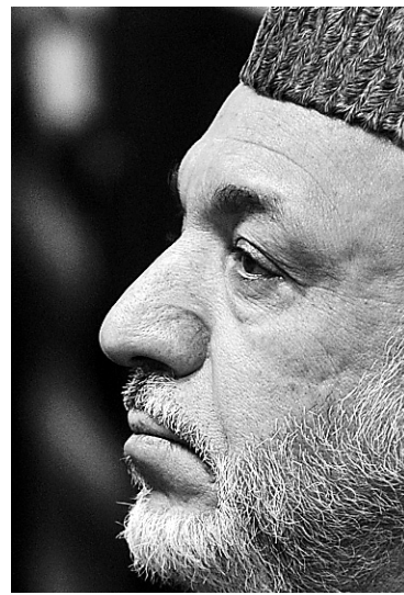
Hamid Karzaï