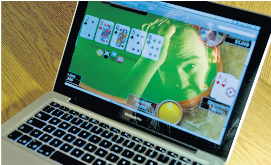
On estime qu'en donnant le droit à Loto-Québec d'exploiter les jeux en ligne, on normalise la pratique, ce qui peut attirer une autre clientèle, notamment les jeunes et les personnes âgées.