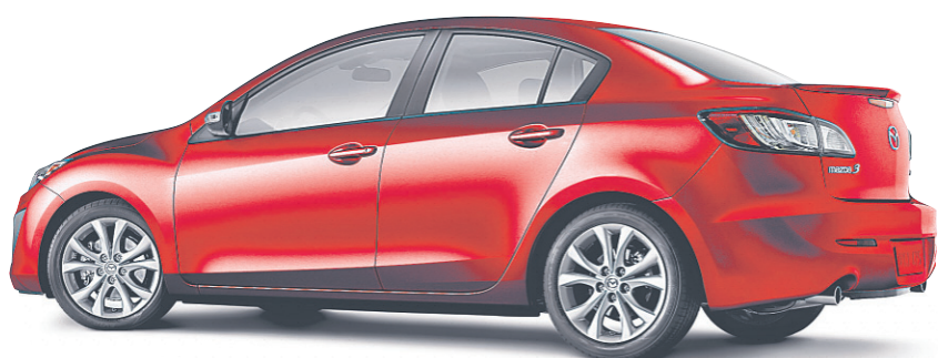
Modèle GT illustré