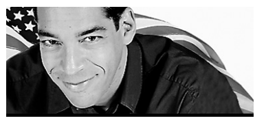
RICHARD HÉTU COLLABORATION SPÉCIALE

NEW YORK — Barack Obama a rompu hier l'ambiguïté entretenue par ses prédécesseurs à la Maison-Blanche sur les conditions dans lesquelles les États-Unis utiliseraient l'arme atomique.