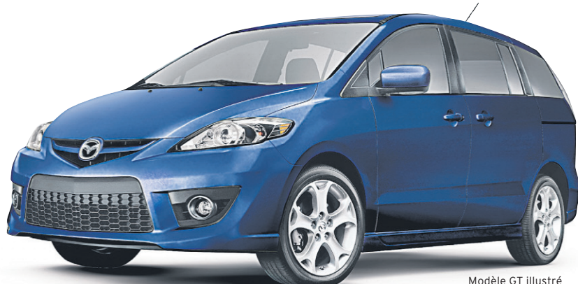
Modèle GT illustré