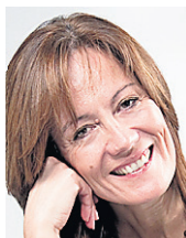
L'auteure est « coach de vie » et a écrit Le syndrome de Tarzan chez Béliveau éditeur.

Pourquoi la pédophilie vous choque-t-elle à ce point quand elle frappe dans les rangs des hommes de l'Église? Parce qu'ils sont censés montrer l'exemple, être abstinentes, protéger les enfants, vos enfants, et non les agresser, violer leur corps et souiller leur âme.