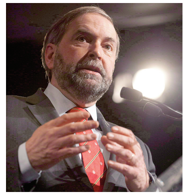
Thomas Mulcair veut profiter du congrès pour mieux se faire connaître.

Mais c'est dimanche qu'un sujet de discordance qui hante le NPD depuis des années sera à l'ordre du jour. Après avoir été mise de côté au congrès de 2011, à Vancouver, l'importance accordée aux principes socialistes du parti dans le préambule de la constitution revient au programme des discussions. Abordée brièvement il y a deux ans, l'idée de moderniser le préambule avait néan-