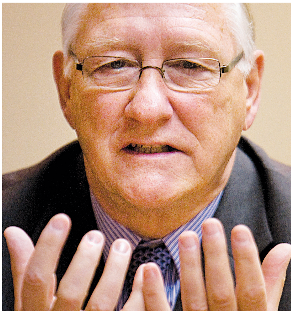
Les révélations de collusion et de corruption liées à l'administration Tremblay ont effrayé plusieurs donateurs potentiels.

Boudée par des donateurs potentiels, la direction de l'organisme voudrait changer son nom