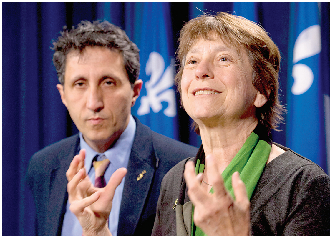
JACQUES BOISSINOT LA PRESSE CANADIENNE

Dans certaines officines, on semble rêver d'un monde lisse sans différences de sexes, de cultures et de nations, où il n'y aurait plus que des êtres abstraits sans chair et sans beauté. Devant cette disparition des sexes rêvée par quelques fanatiques, permettez cette seconde question tout aussi simpliste: s'il n'y a plus de femmes, qui donc civilisera les hommes?