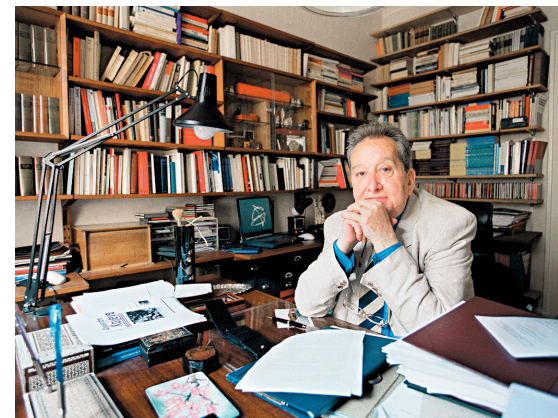
Raymond Boudon, photographié dans son bureau à Paris, en 2001