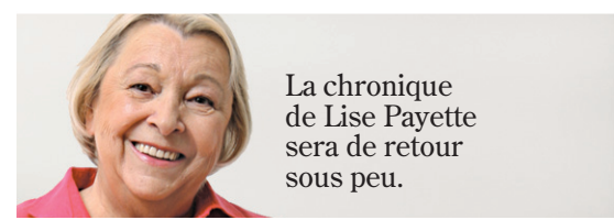
La chronique de Lise Payette sera de retour sous peu.