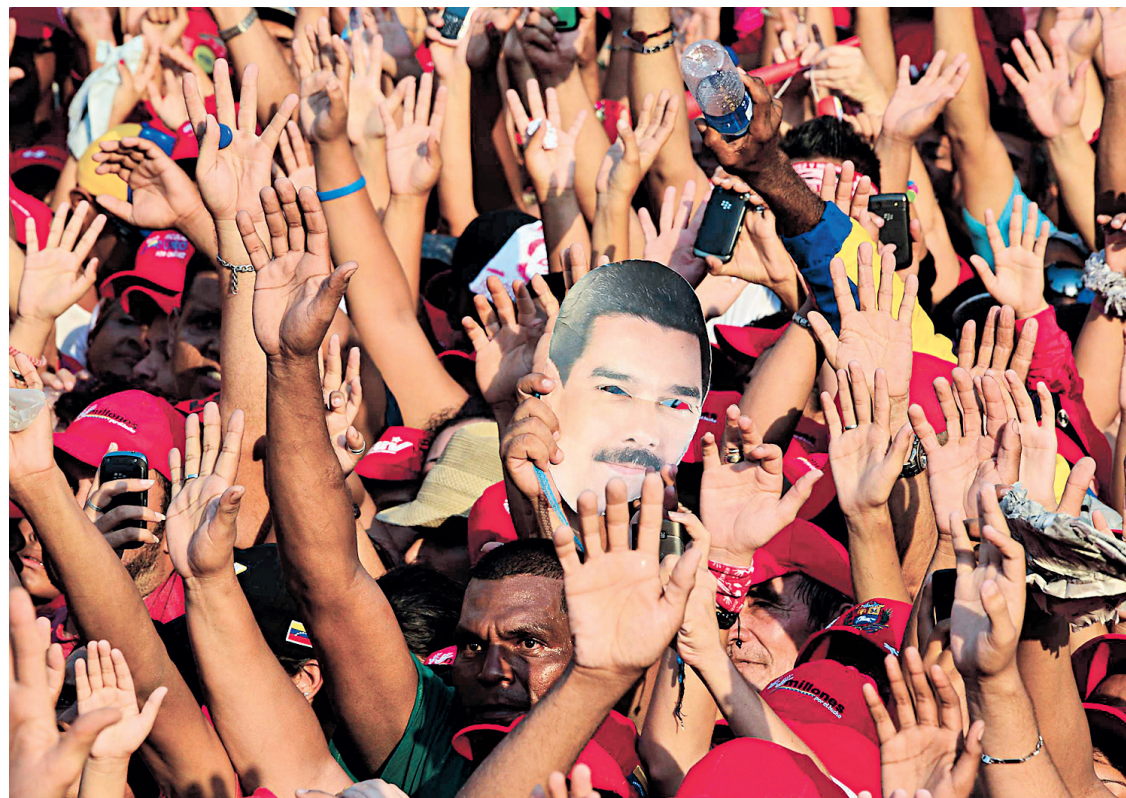
Ses partisans applaudissent le chef du parti au pouvoir et successeur du Comandante , Nicolas Maduro.