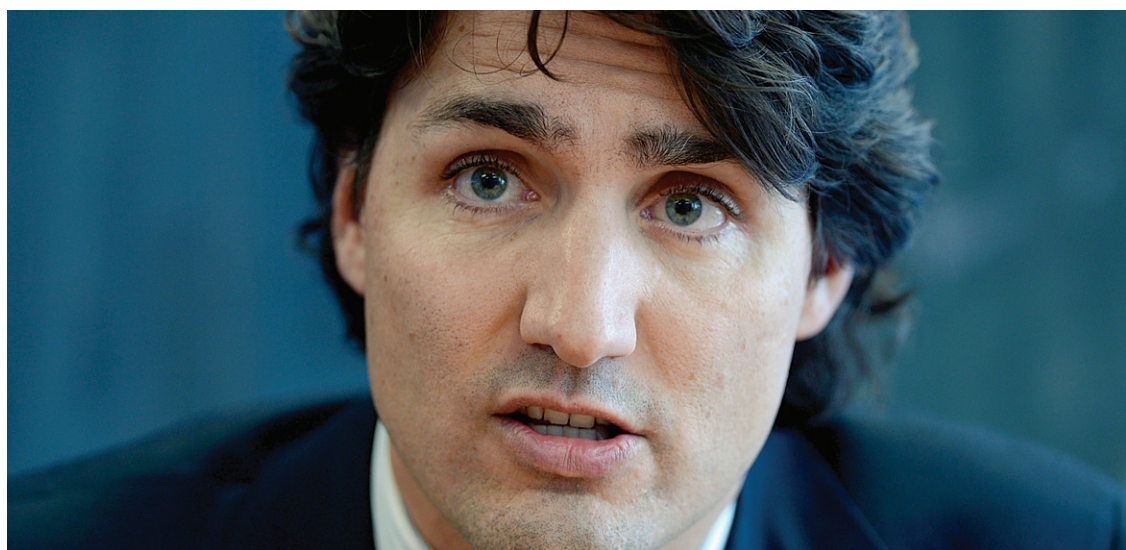
ADRIAN WYLD LA PRESSE CANADIENNE

Justin Trudeau estime qu'en soulevant une controverse au sujet du rapatriement de la Constitution, les souverainistes essaient « de retrouver un niveau de pertinence, de présence, dans l'esprit public ».