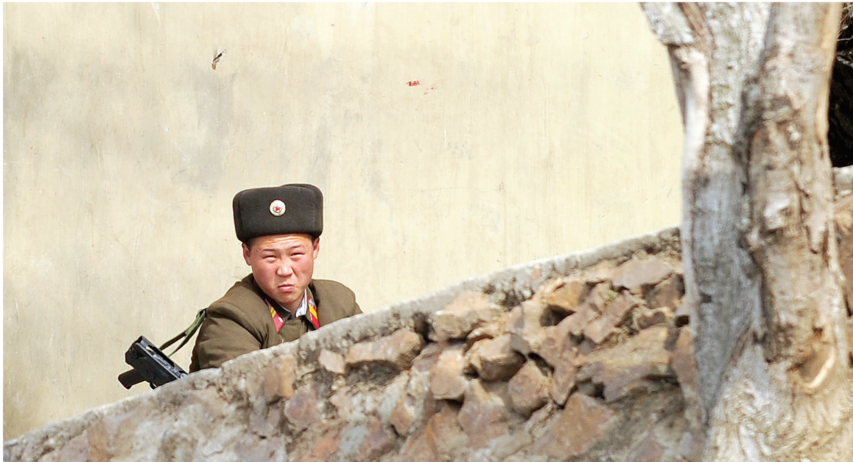
Un soldat nord-coréen patrouille à la frontière commune avec la Chine. La stratégie dont use la Corée du Nord est fragile et dangereuse, mais si elle est bien maniée, elle offre à ce petit pays exsangue une capacité de nuisance, et donc de marchandage, totalement disproportionnée.

Les États proliférants s'efforcent généralement, une fois qu'ils ont constitué un arsenal nucléaire, de définir une doctrine de dissuasion informant les agresseurs éventuels des réponses auxquelles ils devraient s'attendre. L'Inde et le Pakistan se sont ainsi échangés des signaux très clairs en ce sens après leurs campagnes d'essais en 1998, et ont instauré une sorte d'équilibre de la terreur calqué sur le modèle de la guerre froide. Pyongyang a pour sa part choisi de terroriser ses voisins en brandissant la menace de l'emploi, et allant même jusqu'à l'annoncer en réponse à ce qui serait perçu comme une provocation. Il s'agit là d'une nouvelle forme d'utilisation de l'arme nucléaire, qualifiée de stratégie du fou en ce qu'elle s'inspire de la Mutual Assured Destruction (MAD), et est renforcée par le caractère souvent jugé imprévisible du régime nord-coréen. Le message pourrait ainsi être caricaturé par : « Ne m'approchez pas de trop près où je fais tout sauter. » En terrorisant ses adversaires, et en utilisant à cet effet son arme nucléaire, puisque ses capacités conventionnelles dépassées n'ont pas le même effet, Pyongyang pratique une forme de dissuasion par le chantage. Il faut remonter, toutes proportions gar-