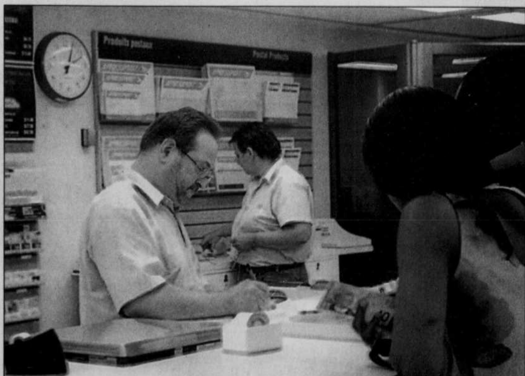
Les postiers sont sans contrat de travail depuis le début de l'année.

À l'origine, la grève était prévue pour vendredi dernier mais une entente de dernière minute entre les deux parties a repoussé la grève à dimanche. Une deuxième