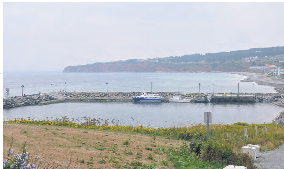
Le ministère se dit conscient du problème d'ensablement récurrent et affirme vouloir poursuivre ses travaux en vue de déployer une solution pérenne.

Au 31 mars 2024, les revenus générés par les ports de la Société portuaire ont augmenté de 24 %, par rapport à l'année précédente, à 2,3 millions de dollars. La proportion des exportations représente 30 % des échanges commerciaux, tandis que la part du transport régional a compté pour 68 % à destination de la Côte-Nord et du Grand Nord canadien.