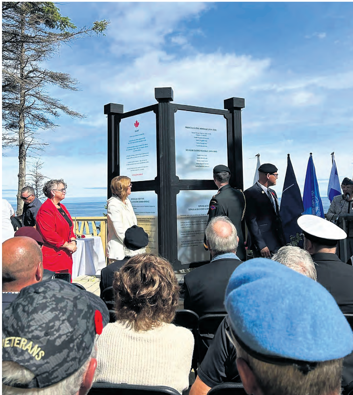
Le cénotaphe est aussi dédié à ceux qui ont servi ou qui servent toujours sous les drapeaux.