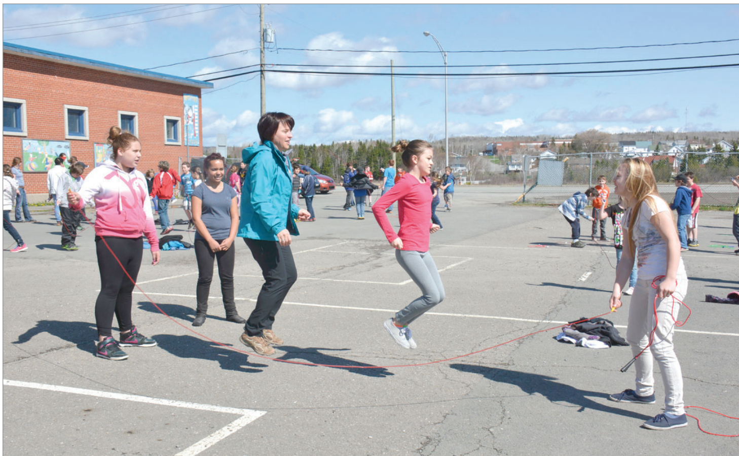
Les sauteurs ont amassé près de 8 000 $.

www.hebdosregionaux.ca/gaspesie/mon-topo