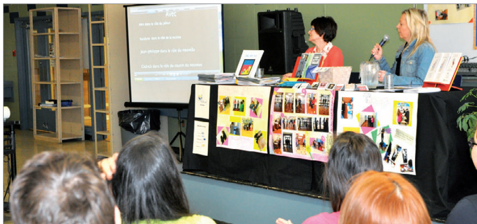
Un court métrage intitulé «Jalousie», sur le thème de l'intimidation, réalisé par une des équipes d'étudiants a été présenté lors du lancement du recueil