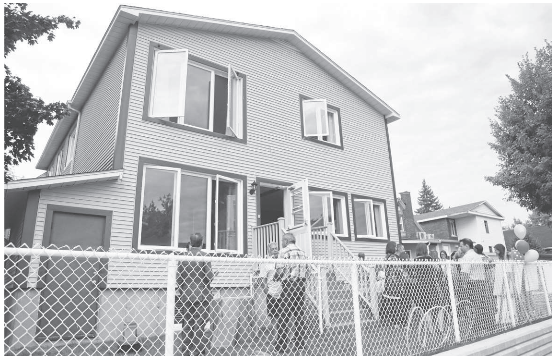
La nouvelle cour extérieure de la Maison des Familles de Granby et région a été inaugurée jeudi dernier.

Ainsi, la cour a été aménagée pour permettre aux enfants de s'amuser en toute sécurité. « Nous