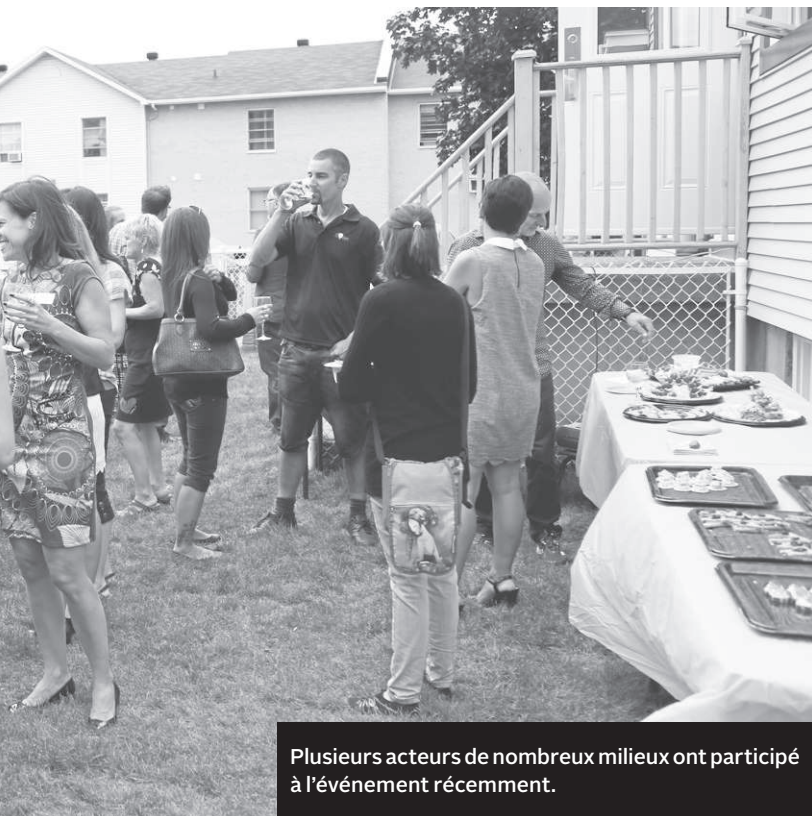
Plusieurs acteurs de nombreux milieux ont participé à l'événement récemment.

s'ajouter aux participants. Ces ateliers, qui prennent la forme d'une aide aux devoirs personnalisée pour les enfants de première et deuxième année (une fois semaine pour les élèves de troisième année), visent à favoriser la réussite scolaire de petits qui vivent en contexte de vulnérabilité. Les écoles primaires Ave-Maria de Granby et l'Orée des cantons, pavillon Notre-Dame, à Waterloo, y participent. En parallèle, ce programme aide le parent à reprendre le rôle qui lui revient dans la persévérance scolaire de son enfant.