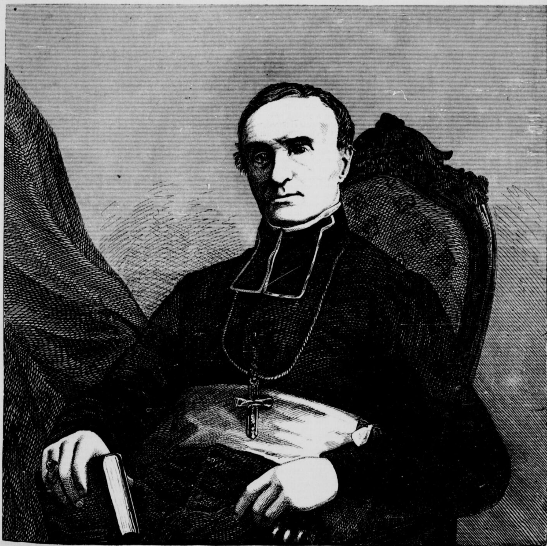
MONSEIGNEUR CHARLES-FRANÇOIS BAILLARGEON, ARCHEVÊQUE DE QUÉBEC VOIR PAGE 328.