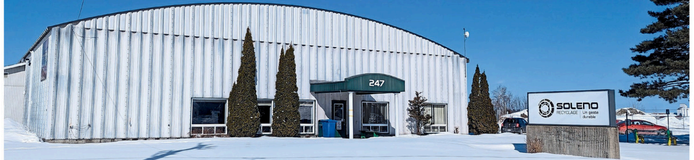
L'Usine Soleno Recyclage de Yamachiche