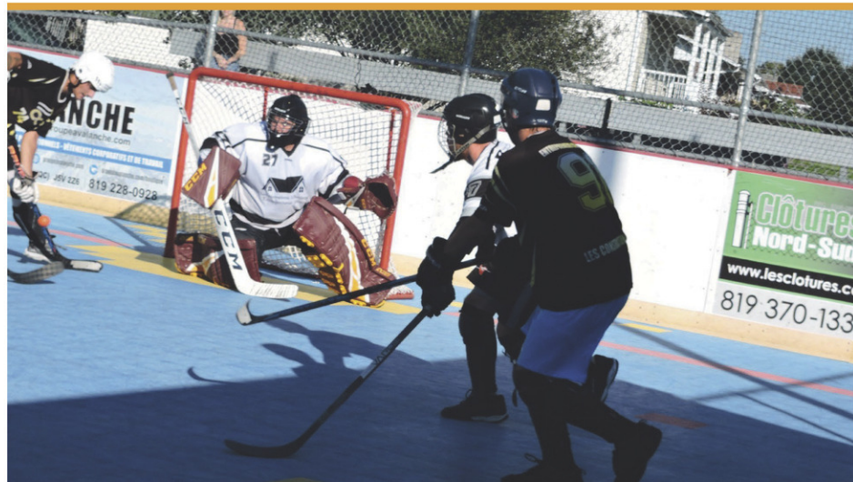
Des milliers de joueurs ont pu y prendre part, été après été, mais le temps est venu aux nouveaux administrateurs de mettre fin aux activités.

La Mauricie est absente dans les disciplines de karaté, escrime, haltérophilie et ski de fond.