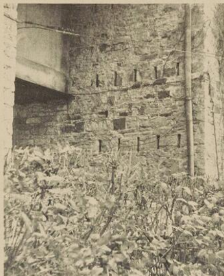
Aération par "meurtrières"

Qu'avons-nous trouvé? Une maison et un parc admi-