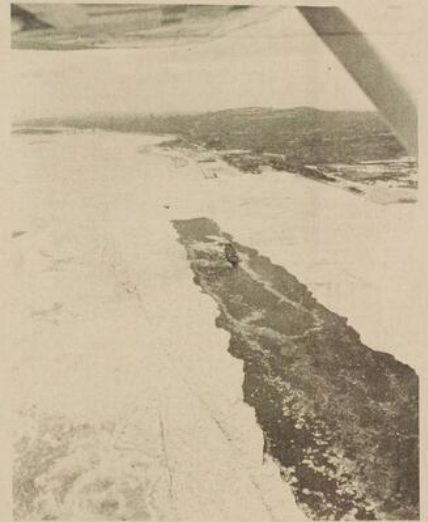
Dans un pareil chenal, nos navires québécois auraient-ils encore besoin de coques blindées?

Deux conclusions à tirer de la genèse de cette navigation hivernale. D'abord, réalisation entièrement québécoise. Ce sont des Québécois qui par leur compétence, leur esprit d'initiative,