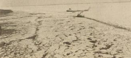
"Assistance à navire en danger" Seul cas où Ottawa autorise ses brise-glaces à faciliter la navigation sur le St-Laurent glacé.