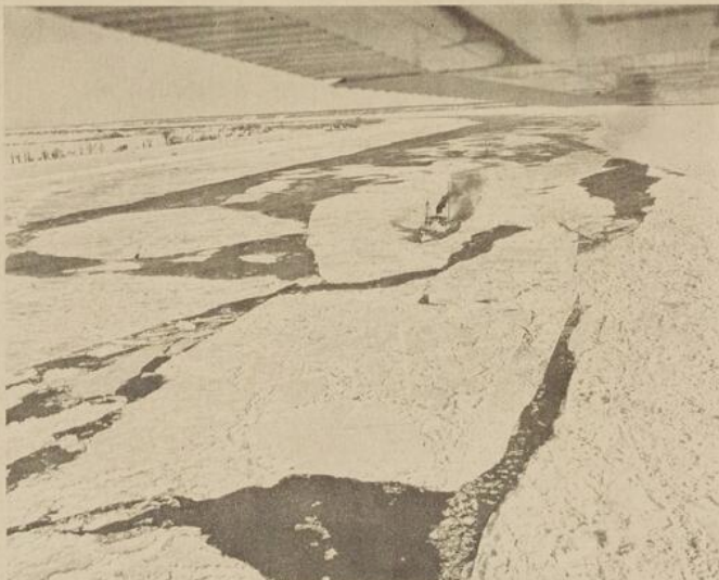
La navigation dans de telles conditions sera toujours difficile et risquée tant que la flotte insuffisante des brise-glaces devra s'occuper surtout à prévenir les inondations.

leur audace ont infléchi le déroulement de l'histoire en imposant à tous la possibilité de naviguer en hiver sur le Saint-Laurent.