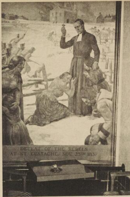
The defeat of the rebels

Perte encore plus regrettable que celle du musée, Papineau avait installé dans un bâtiment spécial, à deux pas du manoir, ses collections historiques sur la révolte de 1837. Les nouveaux maîtres n'ont évidemment pas eu le souci de conserver cet ensemble: tout a été dispersé, égaré,