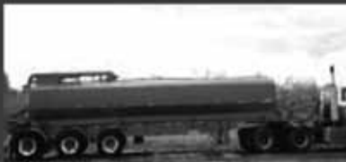
Citerne pour fumier liquide