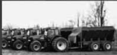
Epandeurs pour fumier solide