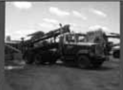
Pompe à fumier liquide