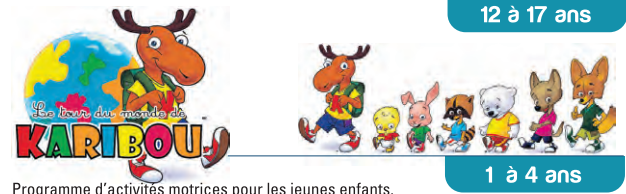
Programme d'activités motrices pour les jeunes enfants.

À LA BIBLIOTHÈQUE RINA-LASNIER 57, rue Saint-Pierre Sud Tél. : 450 755-6400