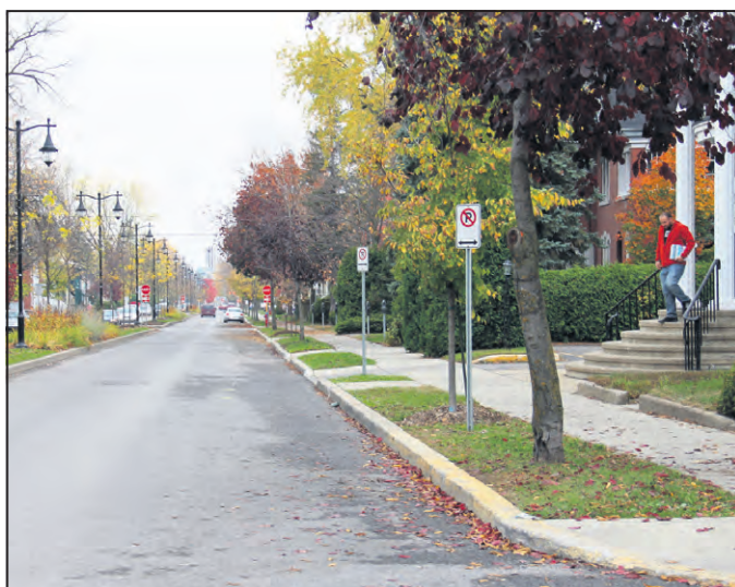
Des « parco-jour » seront installés prochainement sur le boulevard Manseau face à l'ancien salon funéraire Garceau et Garceau.

Ainsi sont apparus les « parco-jour » : alors que le coût du stationnement est de 25 ¢ par tranche de 20 minutes pour un maximum de deux heures sur la place Bourget et en périphérie, le tarif des « parco-jour » sera de 25 ¢ par heure pour une durée maximale de dix heures, ce qui devient intéressant pour les employés du centre-ville et les étudiants. Ces « parco-jour » seront situés sur la rue Saint-Charles-Borromée Nord (entre les rues Fabre et le boulevard Manseau), sur la rue Saint-Barthélemy (entre la rue Notre-Dame et le boulevard Manseau), sur la rue Lajoie (entre Saint-Louis et Manseau) et prochainement sur le boulevard Manseau face à l'ancien salon funéraire Garceau et Garceau. D'autres sont à venir.