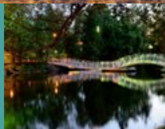
OUVERTURE DE LA PASSERELLE PRÉVUE DÈS LA FIN AVRIL !

Mentionnons que le mérite Ovation municipale de l'UMQ souligne chaque année les solutions