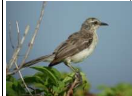
Moqueur des savanes