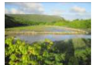
La saline des sables, qui accueille une trentaine de sarcelles en hivernage.

Pour ceux qui ont besoin de calme et de dépaysement, la Désirade est le lieu idéal. On peut y associer facilement balades ornithologiques et familiales. L'île peut se visiter en une journée, en voiture, scooter ou à pied pour les plus courageux.