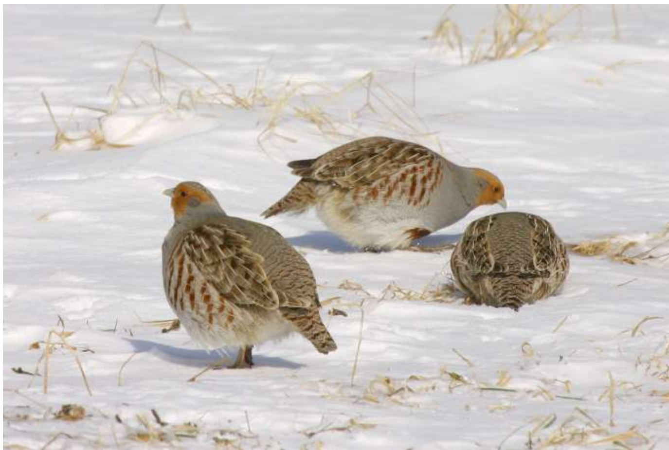
Perdrix grises - Mirabel.

Le COL a maintenant sa page Facebook. Joignez-vous à nous!