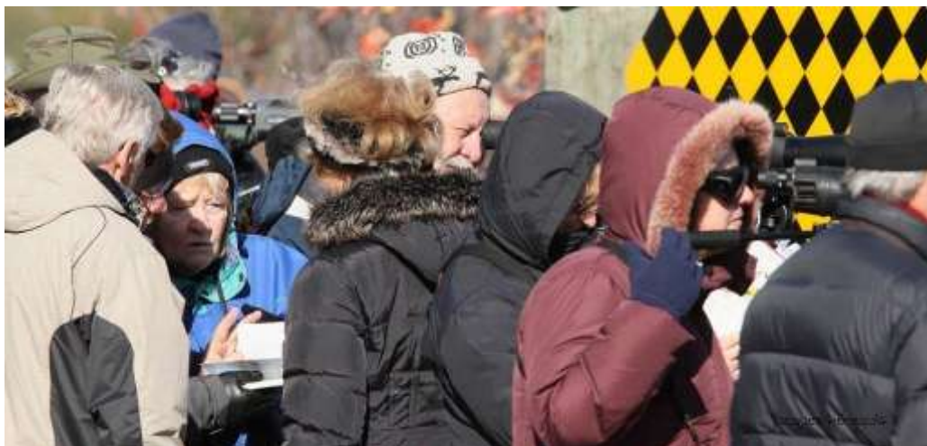
On observe et on analyse, au bord du Bassin de Chambly. (Photo Jacques Héneault 11.10.29)

Jumelage : Assurer le suivi du jumelage avec le club AMAZONA