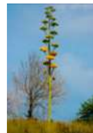
Agave en fleur.