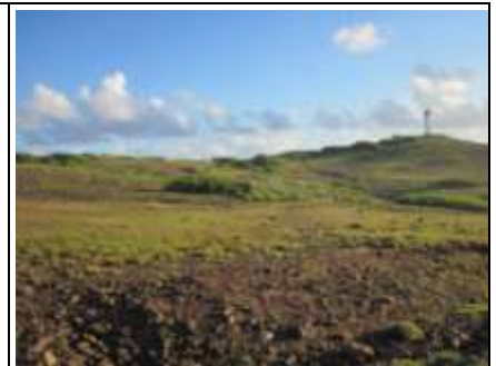
Le phare, situé à la Pointe est. Paysage typique de l'île

La Désirade est une île de l'archipel guadeloupéen qui se trouve à l'est de la Grande-Terre. Elle mesure environ 11 kms de long pour 2 de large et culmine à 276 m, il y avait 1600 habitants en 2006. Elle est accessible en bateau au départ de Saint François (45 min de traversée) ou en petit avion privé. La végétation de l'île est de type xérophile, la pluviométrie annuelle y est faible. Deux lagunes de petite taille sont menacées de remblaiement.