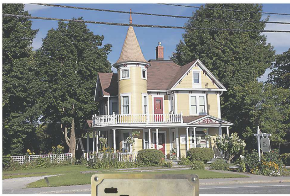
88, rue Queen Street