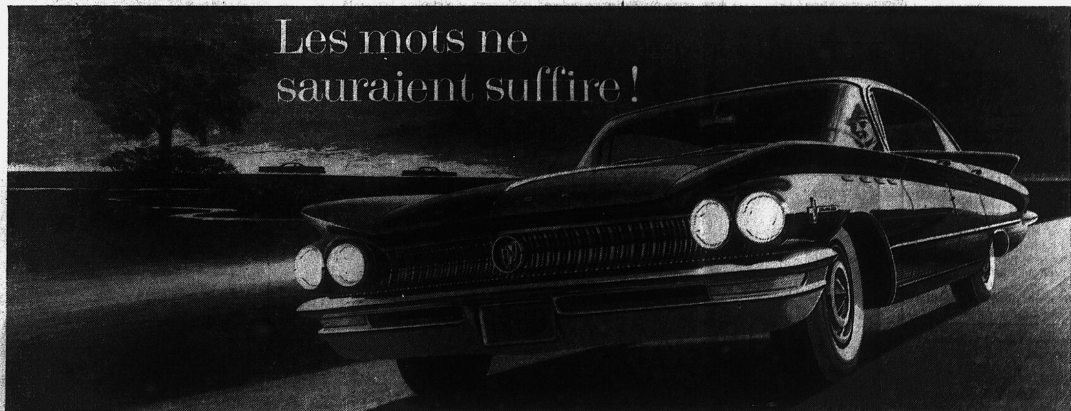
UNE VALEUR GENERAL MOTORS Sedan 4 portes ELECTRA 225 Riviera

Seul un essai lui rend justice en prouvant qu'il s'agit bien de