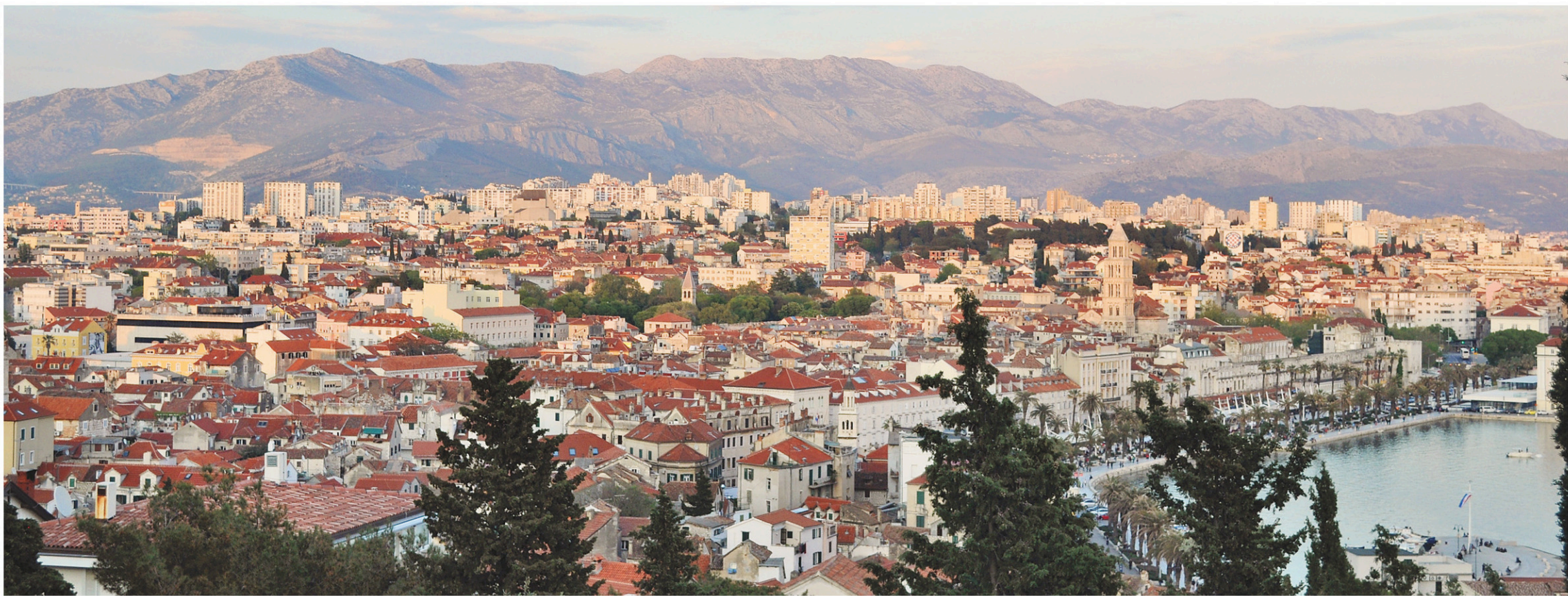
Depuis les hauteurs du parc Marjan, la vue sur la ville de Split est incroyable, et encore plus au coucher du soleil.

Depuis la fin des années 1990, la Croatie ne cesse d'attirer les voyageurs. Rappelons qu'il a fallu attendre l'éclatement de l'ex-Yougoslavie ainsi que la fin de la guerre civile, qui a fortement touché cette partie de l'Europe, pour que les touristes commencent à envisager de découvrir ce pays.