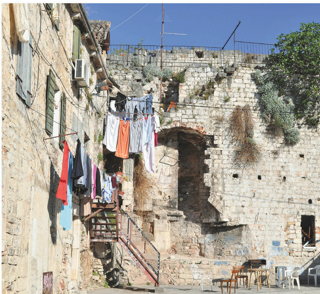
Au fil des années, le palais Dioclétien a été transformé en habitations. À droite: construit entre la fin du III e et le début du IV e siècle, le palais de 38 000 mètres carrés constituait la résidence principale de l'empereur.

Ce qu'on y dénicher à petits prix est aussi fascinant que le spectacle qui se déroule sous nos yeux: des locaux marchandent longuement en croate, tan-