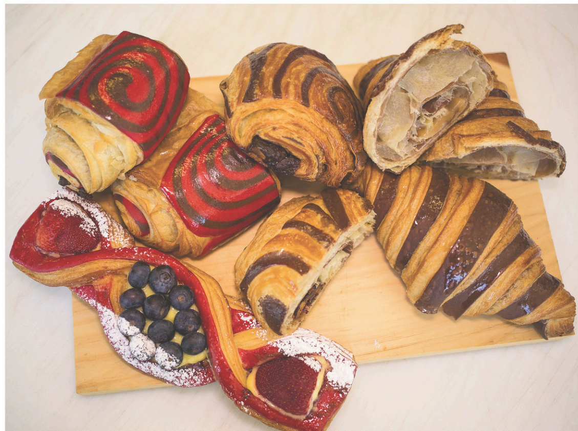
Des viennoiseries créatives (et colorées!) qu'on peut retrouver au café Maesmi