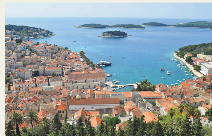
La forteresse Fortica, qui domine la ville de Hvar, offre un panorama incomparable sur le reste de l'île.

De passage à Split, impossible de ne pas réserver au moins une journée pour se rendre sur l'une des îles proches de la côte. Parmi les plus courues, Brač, Hvar et Vis offrent de spectaculaires paysages montagneux et une atmosphère favorable à la détente et à la baignade. Très (voire trop) populaire en plein été, l'île de Hvar nous a semblé la destination idéale pour un mois d'avril ensoleillé. A peine deux heures de traversier et vous voilà sur une île paradisiaque, coupée du monde. En haut de la forteresse, la vue est digne d'une carte postale: des maisons en pierre aux toits rouges, des montagnes en arrière-plan, des champs d'oliviers et de vignes un peu plus loin, et la mer turquoise à perte de vue.