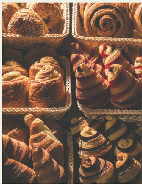
Un étal de viennoiseries aux Enfarinés, à Boucherville