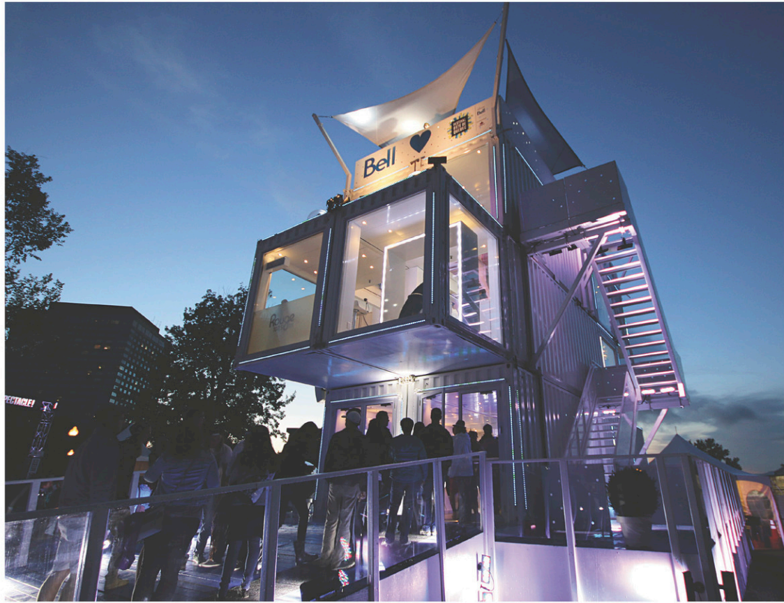
Rue York, à Ottawa, s'installera le Village de l'inspiration constitué de conteneurs maritimes, genre de boîtes à surprises que s'approprieront des artistes de chacune des provinces et des territoires.

En épluchant la programmation d'Ottawa 2017, je remarque que le directeur général a pris bonne note de son constat. J'y vois un parcours souterrain ponctué d'installations hologra-