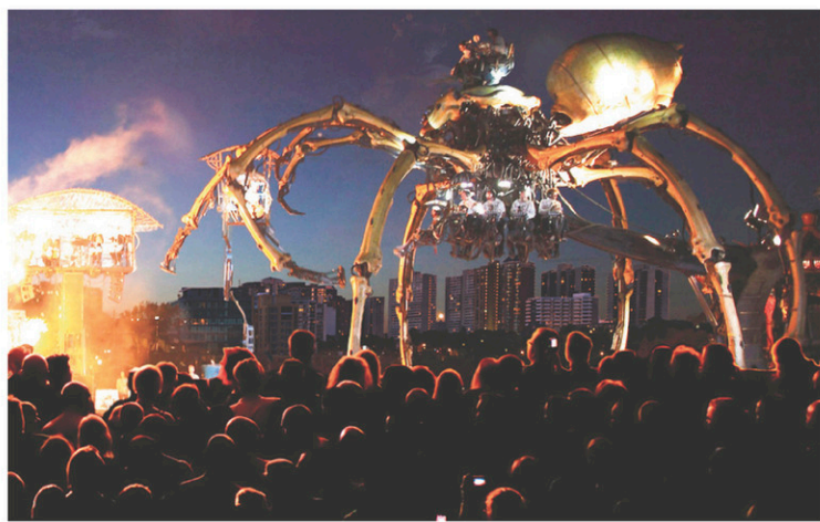
Les créatures de La Machine, une compagnie française de théâtre monumental de rue, envahissent les artères de la capitale fédérale du 26 au 30 juillet.

phiques réalisées par Moment Factory, qui tire profit de la construction de la station Lyon de la ligne de TLR puisqu'elle en sera le théâtre!