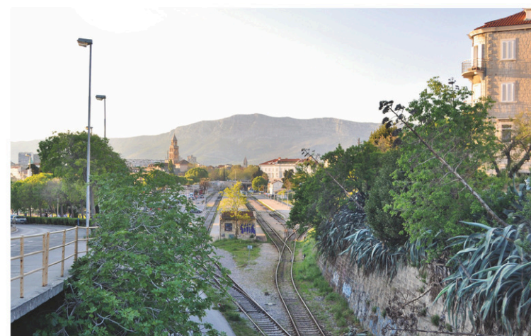
La chaîne de montagnes des Alpes dinariques ajoute du charme à la ville croate.