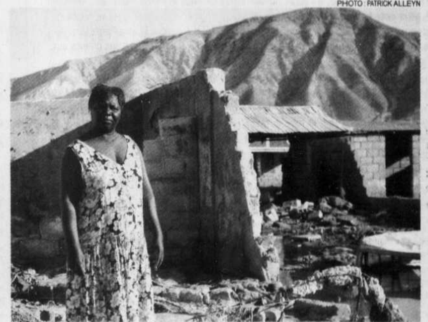
Les travaux progressent aux Gonaïves, mais lentement. Les maisons détruites n'ont toujours pas été reconstruites, alors que de nouveau la pluie sera au rendez-vous, dans un mois ou deux.

Les ONG et les agences humanitaires parviennent à remettre les colis d'aide aux sinistrés, mais opèrent sous la haute garde des militaires de