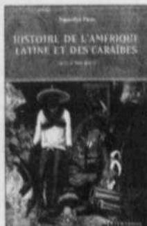
Histoire de l'Amérique latine et des Caraïbes