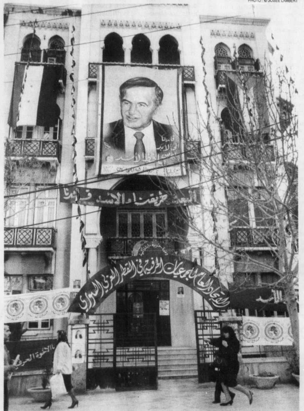
Le lourd héritage d'un régime crispé

Mais les « dinosaures » qui contrôlent l'État et les nombreux ap-