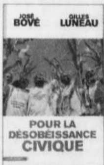
Pour la désobéissance civile