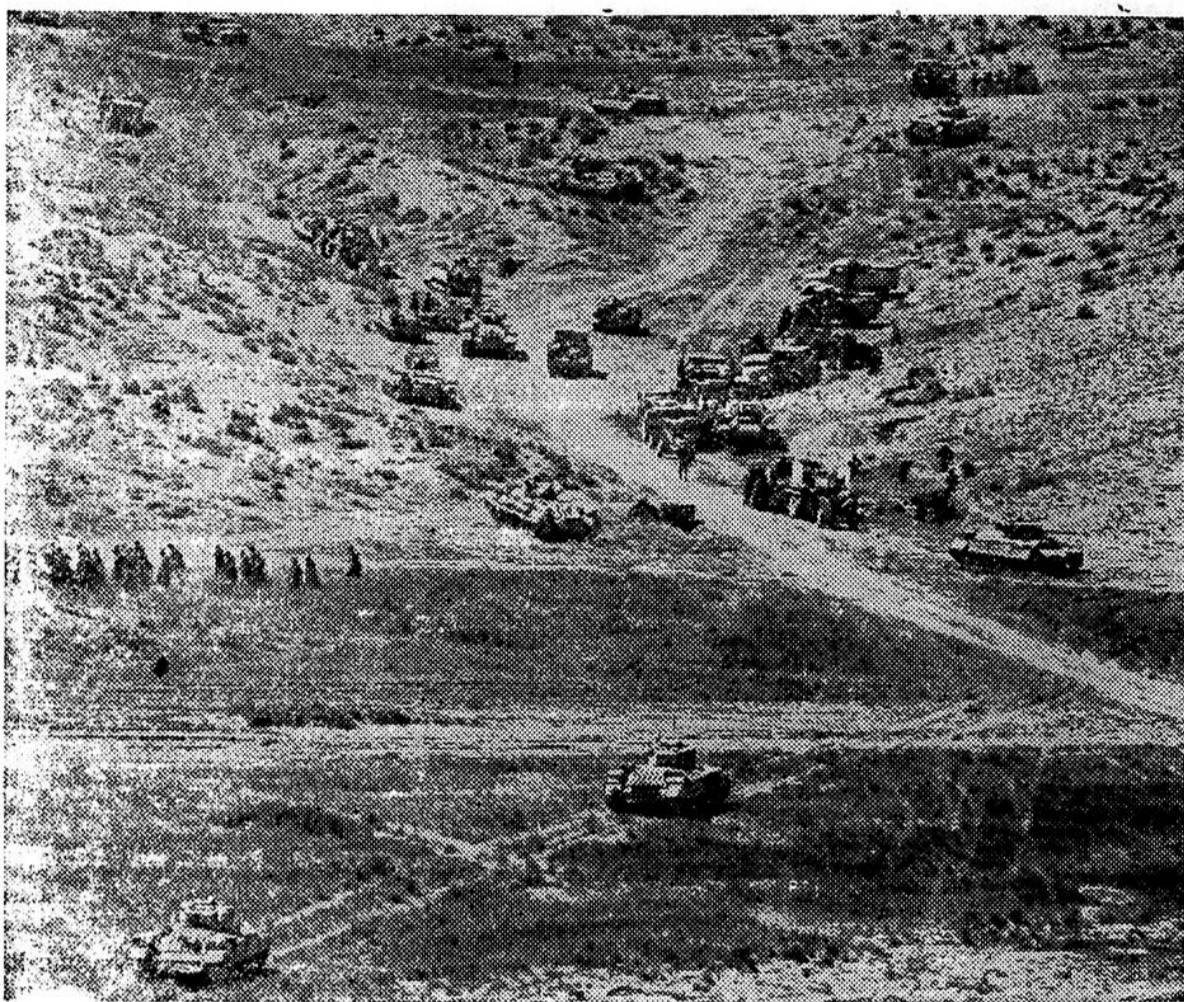
La bataille de la Passe de Gabès, à 10 milles au nord de la ville de Gabès, dans la région d'Oudref, fut le prélude du triomphe stratégique à la source Akarit. Cette photo, prise à l'aide d'un objectif à longue portée, montre l'armée britannique alors qu'elle vient de trouer les défenses de Rommel établies dans la passe de Gabès.