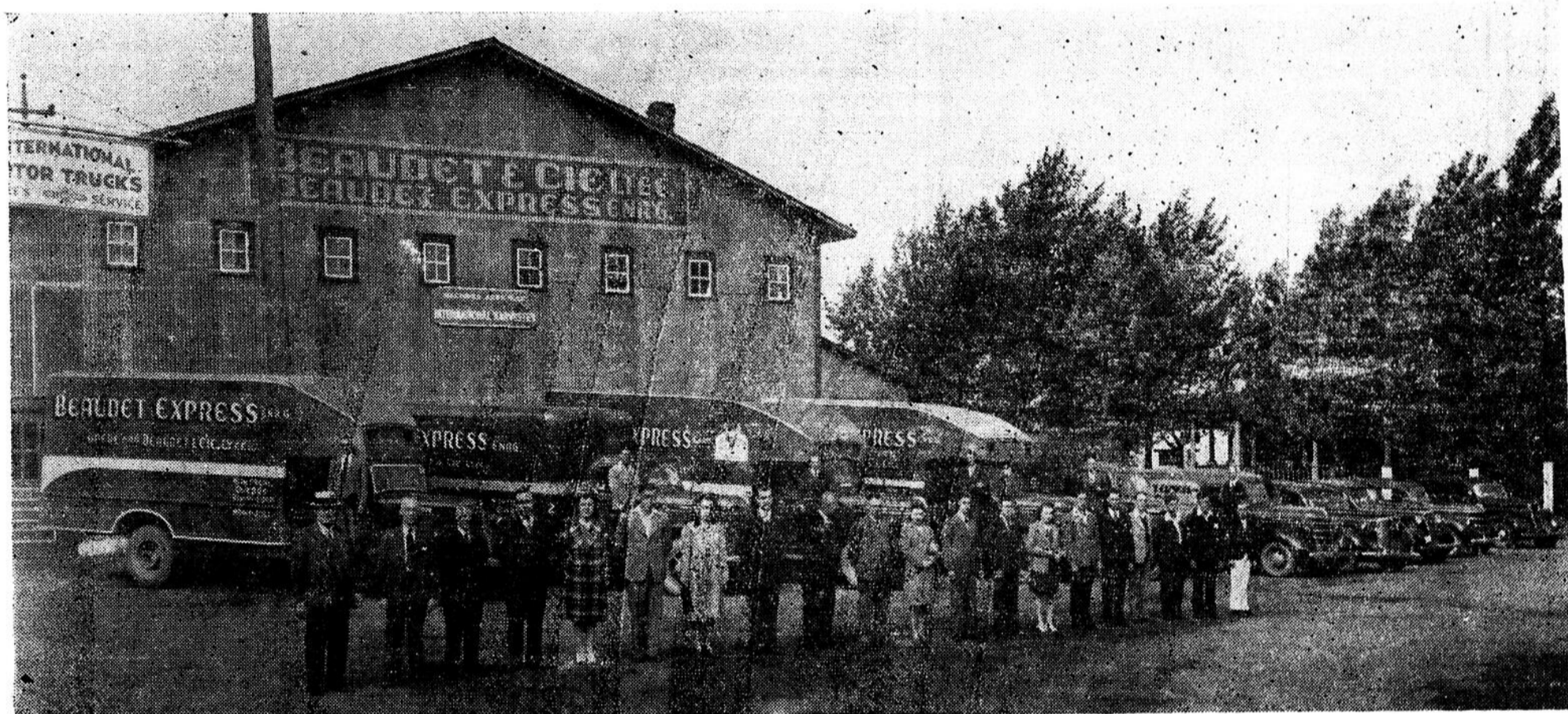
Une partie du personnel et de l'équipement de Beaudet Express Enr'g de Mont-Joli

Faites expédier vos marchandises de Montréal et Québec par notre service de wagons mixtes (Poll Car), elles vous seront délivrées chez-vous avec toute l'attention et la rapidité possible.