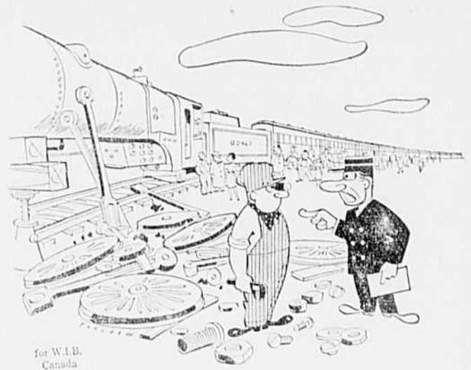
for W.I.B. Canada