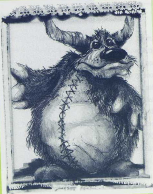
Illustration : Richard Lacroix

DU 14 MARS AU 6 AVRIL 1997 Une production du Théâtre de l'Oeil • 5 à 10 ans