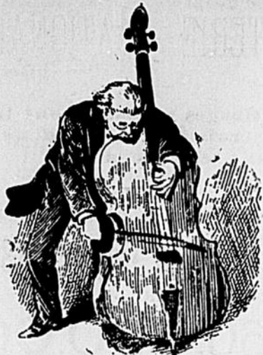
LES SPORTS CRUELS

Vous savez ce que, dans l'argot d'un certain monde, on appelle un sport ?