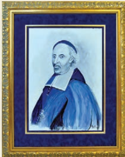
Saint François de Québec

L'artiste Abel a voulu représenter saint François en homme confiant et accueillant, en pleine maturité et à la veille d'entreprendre ses grandes constructions. Pour manifester la simplicité d'un noble et d'un évêque, le peintre l'a dépouillé le plus possible en neutralisant l'arrière-plan et en ne conservant que la croix, attribut de sa fonction. L'artiste a préféré entourer son visage d'une lumière éclatante plutôt que le nimbe soulignant habituellement la sainteté. «La sienne est toute intérieure et elle émane de sa personne» dit-il, reprenant sans doute le témoignage de ses contemporains. «Je trouvais que peindre une auréole nous l'aurait rendu inaccessible. C'était comme le couronner, alors que je le reconnais comme un homme simple et proche des gens. Je suis convaincu qu'il n'aurait pas apprécié. Je voulais qu'il reste celui que ses amis ont côtoyé. Il était déjà saint de son vivant.» C'est dans cet esprit que l'artiste a pris soin de reproduire le visage qu'on lui connaît depuis toujours. «Je voulais qu'on le reconnaisse.»