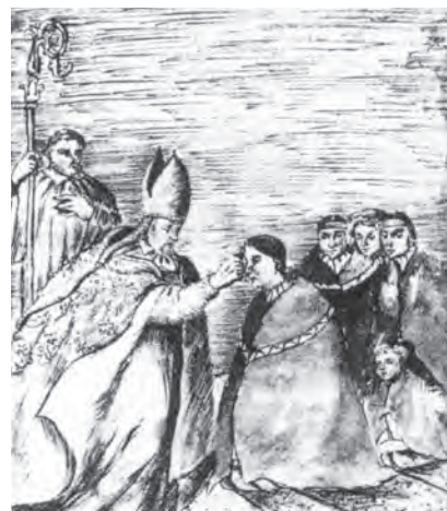
Mgr de Laval confère le sacrement de la confirmation à la mission de Prairie de la Madeleine. Dessin de Claude Chauchetière, sj, 1686.

Mais je ne puis, Monsieur, me dispenser de vous dire que, quand il me revient en la mémoire l'accent et la ferveur avec laquelle Sa Grandeur prononçait ces paroles et beaucoup d'autres pleines de feu et d'amour, les yeux et les mains élevés vers le ciel, avec des sentiments extraordinaires d'humilité et de mépris de soi-même et des retours d'une véritable confiance en Dieu, nonobstant, disait-elle, sa très grande indignité, j'en ai le cœur si pénétré que je ne puis retenir mes larmes; je souhaitais pour lors que toutes les personnes du Canada puissent entendre chacune une seule de ses paroles pour en être toutes embrasées; car elles étaient toutes capables de pénétrer, attendrir et enlever les cœurs même les plus endurcis.