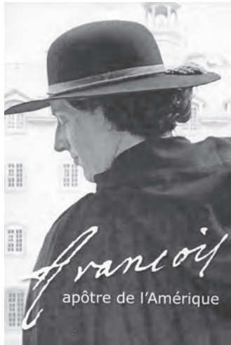
Couverture de la pochette du DVD François, apôtre de l'Amérique