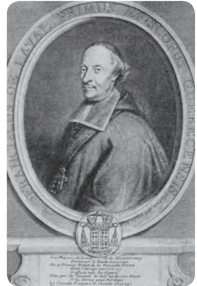
Estampe de Claude Duflos, 1708

Il fallait maintenant choisir l'interprétation. En novembre dernier, l'angle s'est précisé. « Et lorsque j'ai décidé d'utiliser le papier coton comme support, l'application mixte s'est imposée. Tout s'est rapidement mis en place. » Il a peint en camaïeu de bleu (une peinture monochrome utilisant différents tons d'une même couleur, du clair au foncé). « Je me suis appliqué à l'œuvre pendant trois mois, soit de janvier à mars 2015. »