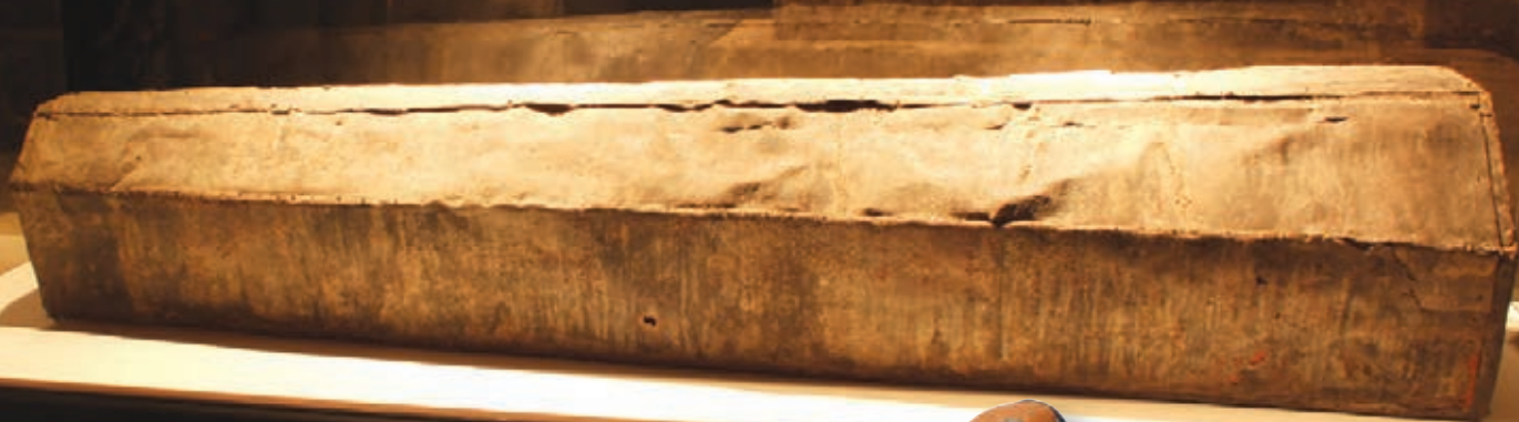
Première tombe de François de Laval ▲