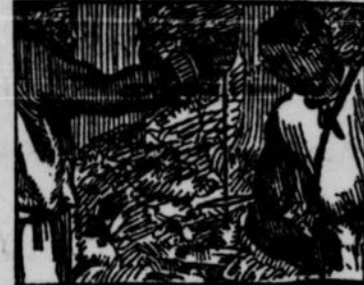
8.—mais où était le nord? Il prit une fine lame de fer qu'il avait sur lui l'aimant, puis la nuit horizontalement au bout d'un fil très fin. L'aimant qu'il avait ainsi tourné vers le nord, leur indiqua la direction à prendre.