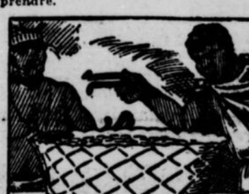
10.—Le ministre vint et, dans les pièces que le roi Congo voulait que l'on imitât chez lui ce qui existait chez les blancs. Son pays devint, comme on doit le penser, tout autre. L'on comprend pourquoi on conserve chez le roi Congo l'aimant dont les premiers merveilleux furent cause de transformations futures.