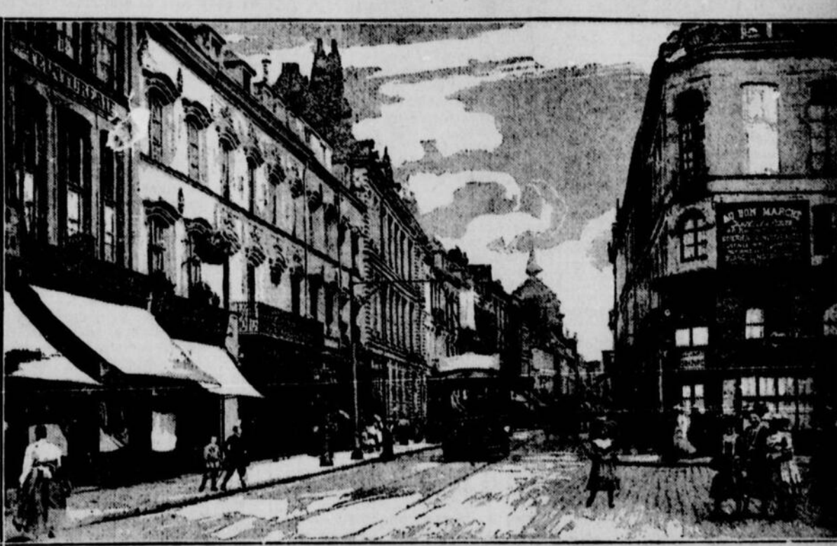
LA RUE DE BELLAIN, l'une des principales artères de la ville de Douai, qui depuis quatre ans était sous le joug de l'ennemi.