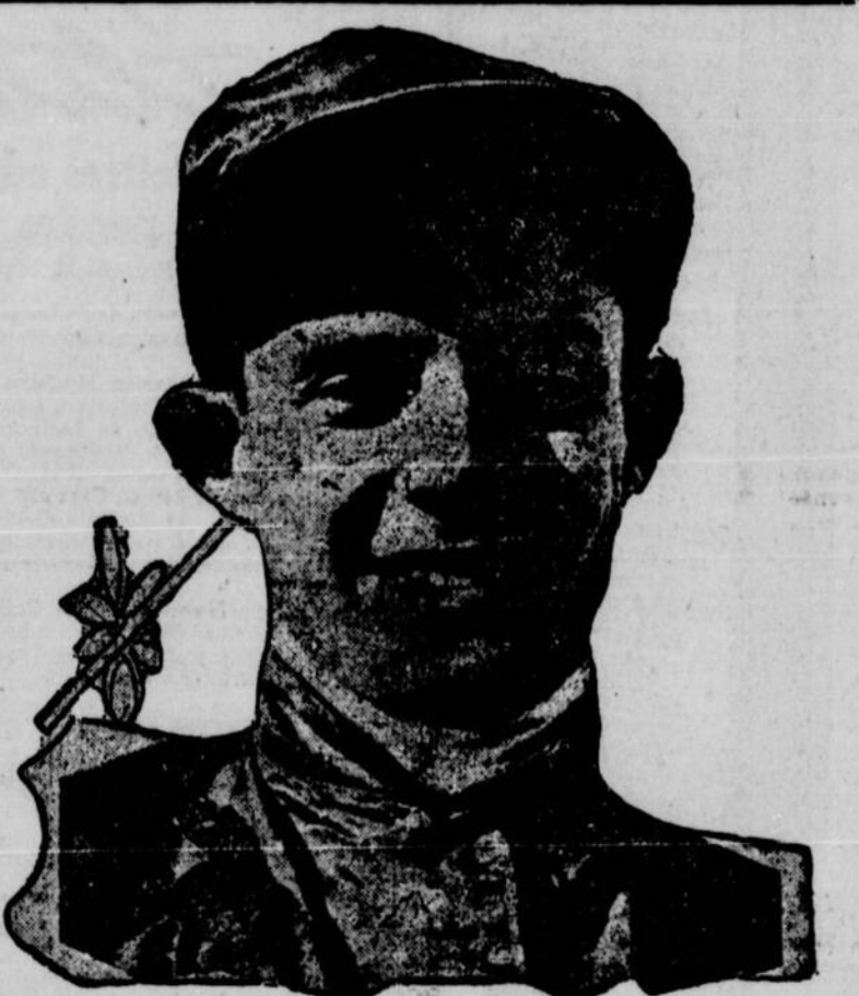
FRANK ROBINSON, le célèbre jockey, qui monte les chevaux de l'écurie Whitney, et qui vient de recevoir l'ordre de se reporter aux États-Unis. Robinson est bien connu des amateurs locaux du turf.