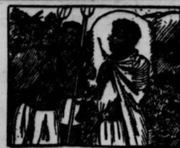
2.—...avait rapporté un jour cet aimant du pays des blancs civilisés. Lorsque il le portait au chevet il ne cessait d'en vanter le pouvoir, ainsi qu'il causait des choses merveilleuses qu'il avait vues chez les blancs.