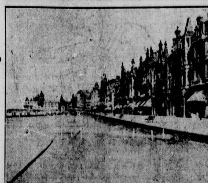
LA PLAGE D'OSTENDE OU LES ALLEMANDS AVAIENT INSTALLÉ DEPUIS QUATRE ANS LEURS GROSSES ARTILLERIES. Ostende était jusqu'à ces derniers temps l'une des principales bases des sous-marins allemands.