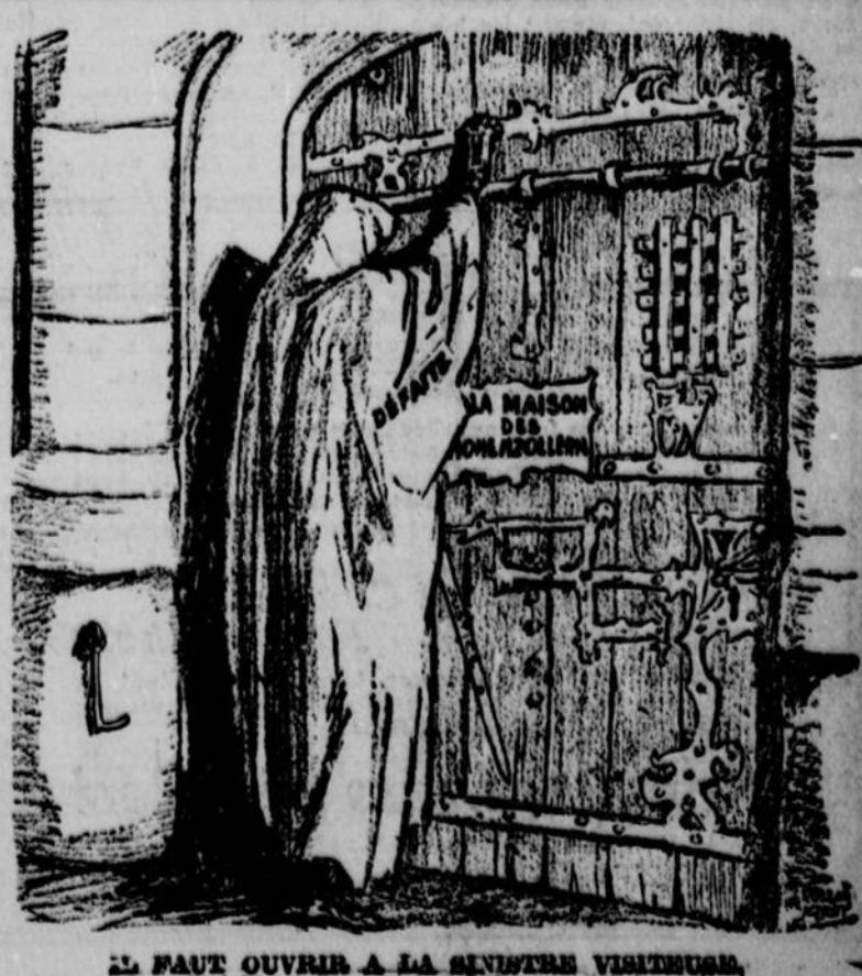
IL FAUT OUVRIE A LA GENDARME VIEILLEUSE.