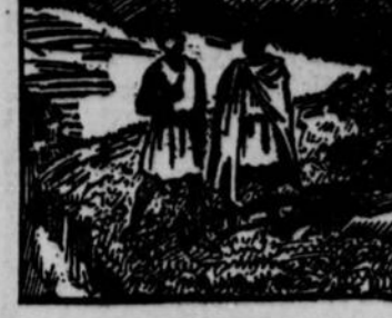
3.—Un jour, ce ministre était en promenade avec un des courtiers de Congo, qui portait chez un roi voisin, de la part du monarque, une sorte de boucle en fer garnie de deux diamants.