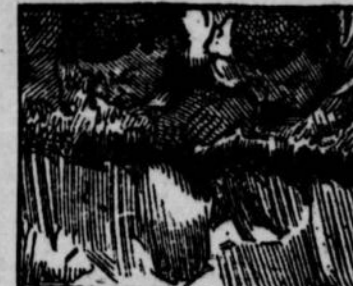
5.—Lorsqu'il apprendrait cette nouvelle. Que faire? Tous deux regardèrent lamentablement le fond du précipice. Le courtier pleurait. Lorsque tout à coup le ministre pensa à son aimant.