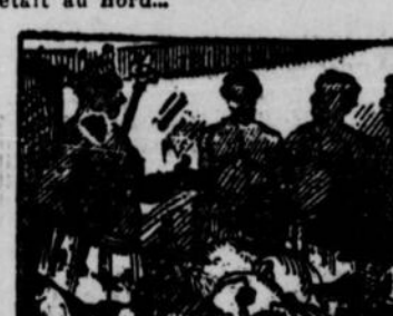
9.—Il avait construit une boussole! Une autre fois encore l'aimant, des tribunaux annuels que lui envoyait le roi Congo, mais il soupçonnait que, parmi les pièces d'argent qu'il avait reçues, il y en avait en fer imitant les vraies.