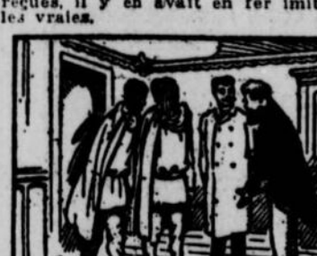
11.—Les merveilleuses obtenues par cet aimant décidèrent Congo à envoyer chez les blancs civilisés une mission, devant étudier tout ce qu'elle y verrait d'aussi intéressant que le monde du ministre. La mission rapporta de là-bas...