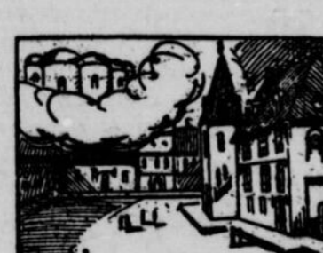
12.—...des documents si intéressants que le roi Congo voulut que l'on imitât chez lui ce qui existait chez les blancs. Son pays devint, comme on doit le penser, tout autre. L'on comprend pourquoi on conserve chez le roi Congo l'aimant dont les premiers merveilleux furent cause de transformations futures.