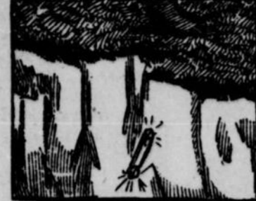
4.—Par malheur, au moment où les deux hommes côtoyaient un profond précipice, le courtier laissa tomber la boucle dans le gouffre. Il fut désespéré, car il portait au chevet un terrible que le roi Congo ne manquerait pas de lui appliquer...