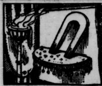
1.—Dans le palais du roi nègre Congo, il y a, à la place d'honneur, un aimant qui est regardé presque à l'égal d'une divinité; nous allons vous raconter son histoire. Un ministre de ce roi...