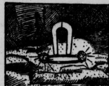
6.—Il l'attacha à une longue ficelle, le descendit dans le gouffre. L'aimant alla la boucle en fer qui fut sauvée... ainsi que le courtier ravi.