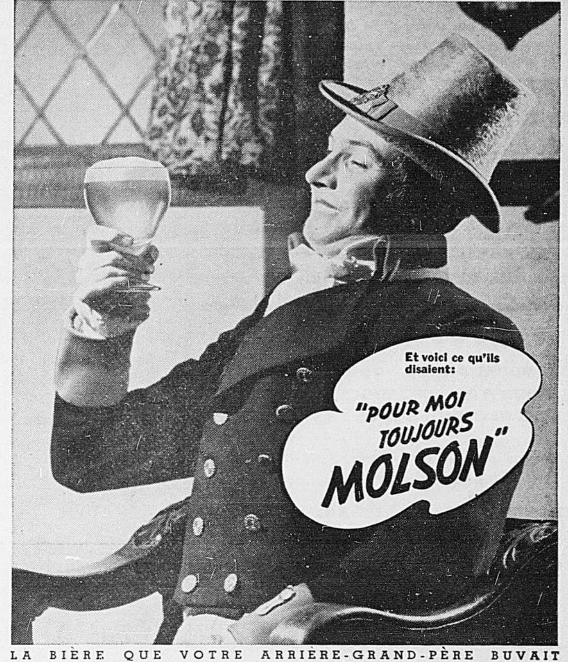
LA BIÈRE QUE VOTRE ARRIÈRE-GRAND-PÈRE BUVAIT