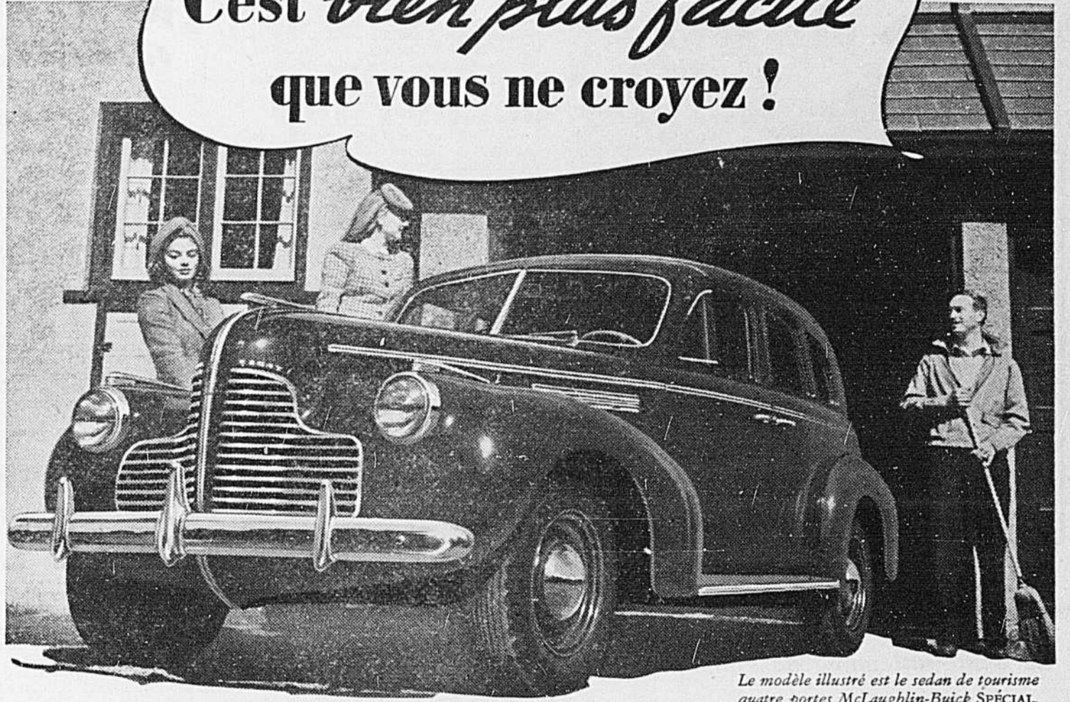
Le modèle illustré est le sedan de tourisme quatre portes McLaughlin-Buick SPÉCIAL.

C'est bien plus facile que vous ne croyez!