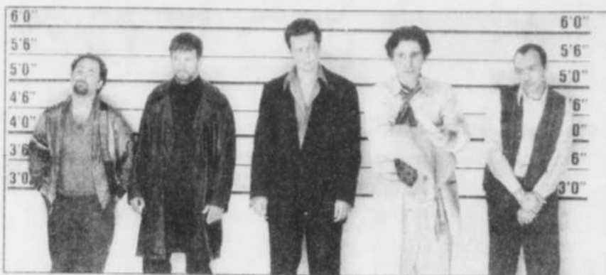
Une brochette de «Suspects de convenance».