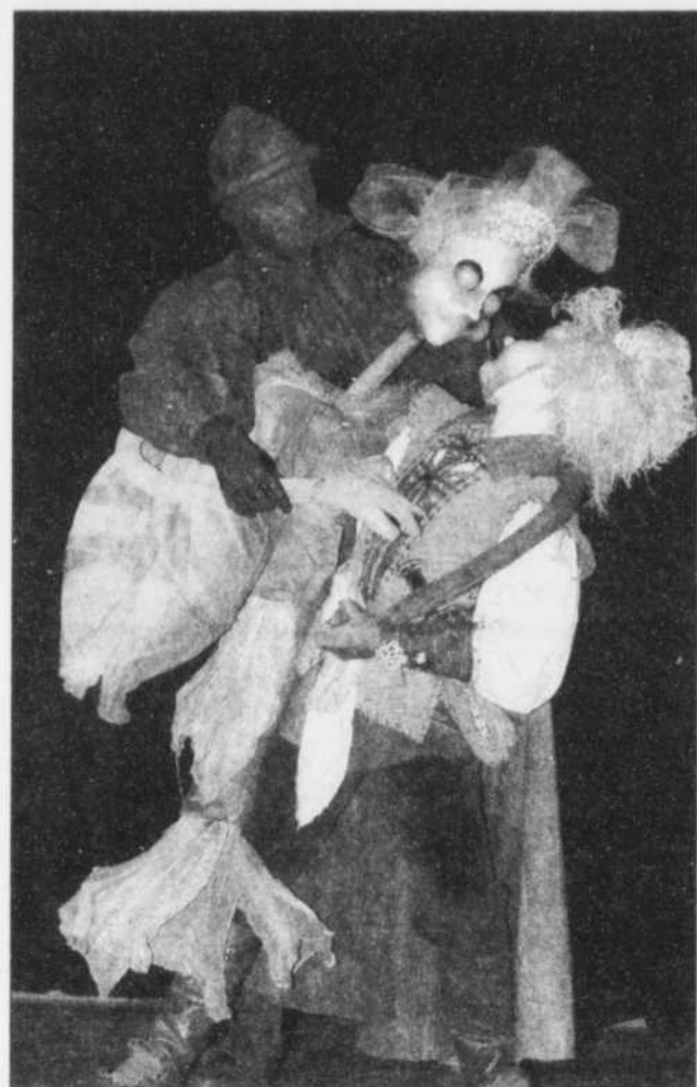
Une princesse, captive de Kastcheï. «L'oiseau de feu», version Zef Théâtre, est présenté ce soir en reprise.

QUÉBEC — Avec une première partie bien ficelée par les interventions carnavalesques du chef Pascal Verrot, et une seconde abordée tout en délicatesse, l'Orchestre symphonique de Québec a présenté hier une soirée amplement contrastée.