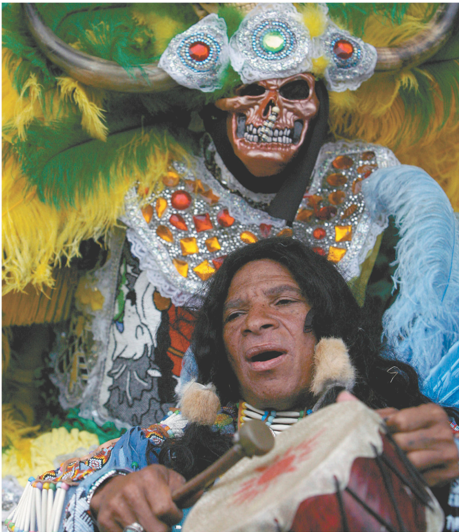
La Nouvelle-Orléans a donné naissance à une culture fortement métissée. Des membres du Creol Wild West Mardi Gras Indians ont donné une prestation au festival Jazz & Heritage de La Nouvelle-Orléans en 2008.

« Les Français n'ont pas le choix de s'appuyer sur les Indiens, même si leur arrivée provoque de terribles épidémies. Ils ont un centre et des satellites souvent très éloignés les uns des autres. Partout, ils construisent des forts près des tribus avec lesquelles ils combattent et font du commerce. Dans les moments difficiles, si un bateau manque par exemple, on envoie les soldats chez les Indiens. Ce sont eux qui assurent leur survie. »