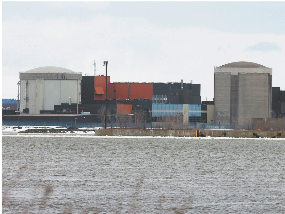
Construit en 1973, le réacteur nucléaire Gentilly-1 à Bécancour se trouve en bordure du fleuve Saint-Laurent.

En juillet, le ministère de la Santé et des Services sociaux (MSSS) a publié son plan d'action interministériel en dépendance 2018-2028. La sensibilisation aux risques des boissons à forte teneur en sucre et en alcool fait partie des dizaines d'actions prévues dans les prochaines années.