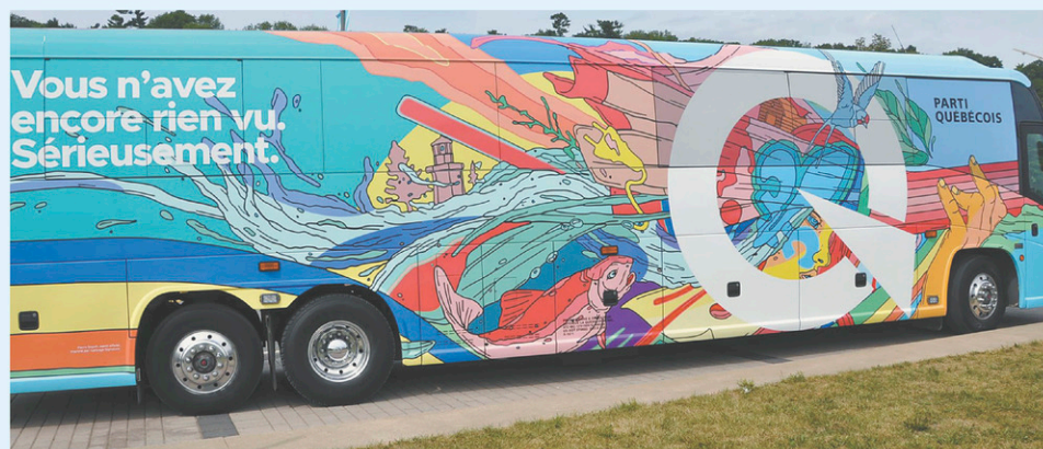
Le Parti québécois joue d'audace avec un autobus aux couleurs psychédélicques.