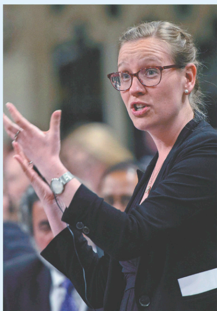
La ministre Karina Gould