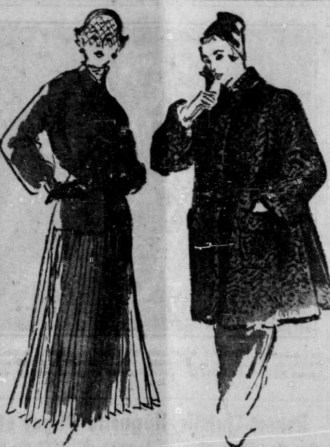
Deux silhouettes populaires cet automne parmi les plus élégantes. L'ampleur va jusqu'à admettre les jupes entièrement par plis. Quant à la jaquette de fourrure, toutes les longueurs sont admises pourvu que celle qui l'en choisit convienne bien à sa silhouette: il y a des manteaux courts qui n'avantagent pas du tout les tailles fortes et petites.