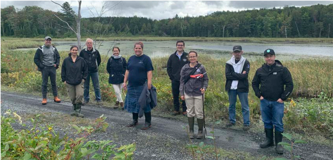
7 septembre: Visite de milieux humides par des élus de notre MRC au lac du Castor.