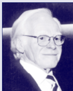
Pierre Bourgault Lauréat du Prix Jules-Fournier 2000.