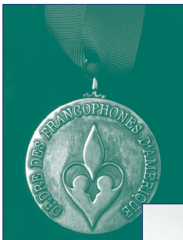
▲ Insigne de l'Ordre des francophones d'Amérique, constitué d'une médaille et d'une fleur de lys stylisée, symbole de l'Ordre, à l'avant de la médaille. Au revers, le nom du récipiendaire est gravé.

L'Ordre des francophones d'Amérique a pour but de reconnaître les mérites de personnes qui se consacrent au maintien et à l'épanouissement de la langue de l'Amérique française sur le continent américain ou sur un autre continent. Les insignes de l'Ordre sont constitués d'une médaille et d'une fleur de lys stylisée, symbole de l'Ordre, montée en boutonnière. Ils sont accompagnés d'un parchemin calligraphié, signé par le premier ministre du Québec, par la ministre responsable de l'application de la Charte de la langue française et par la présidente du Conseil de la langue française.