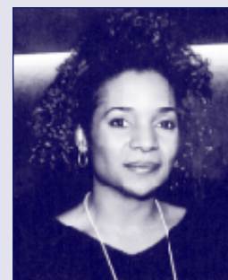
Michaëlle Jean Lauréate du Prix Raymond-Charette 2000.