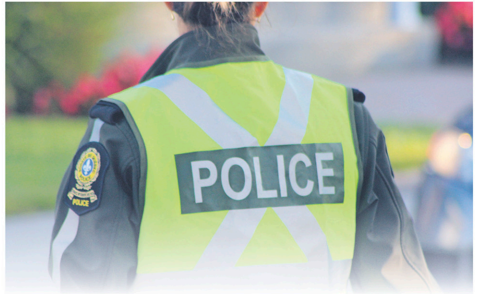
Depuis le début de la pandémie de la COVID-19, la Sûreté du Québec a ajusté ses façons de faire pour assurer la sécurité des citoyens et de son personnel.

On a aussi vu exploser le nombre d'appels logés au Centre de gestion des appels au cours des dernières semaines. Uniquement sur le territoire de la Mauricie, la SQ estime recevoir une centaine d'appels supplémentaires chaque jour en lien avec la pandémie. «Les appels faits à la Sûreté du Québec devraient être uniquement ceux nécessitant une intervention policière. Les préposés des centres d'appels ne font aucune analyse de cas particulier et ne donnent aucune autorisation en matière de déplacements»,