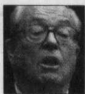
Jean-Marie Le Pen

Jacques Chirac contre 18 % pour Jean-Marie Le Pen. Avec 5,2 millions de voix, ce dernier n'a même pas fait le plein des suffrages qui s'étaient portés vers l'extrême droite au premier tour.