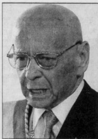
Hugo Banzer: rigide et têtu.

Général de formation, il a débuté en politique alors qu'il n'avait pas encore 40 ans en occupant le portefeuille de ministre de l'Éducation (1964-65).