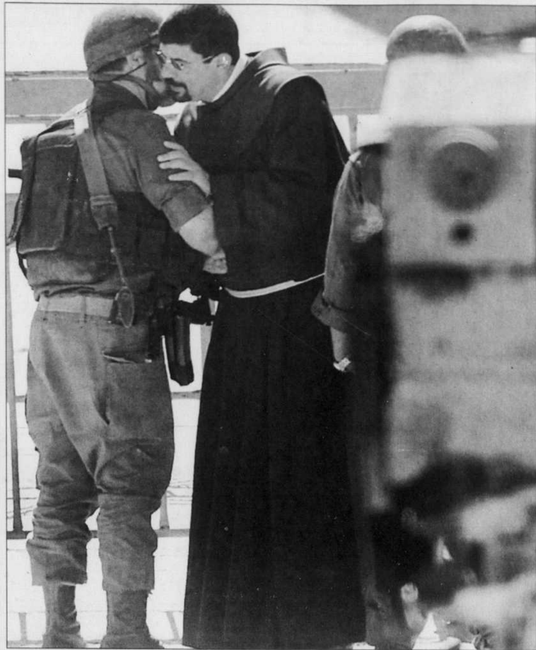
Embrassade hier devant la Basilique de la Nativité, à Bethléem.