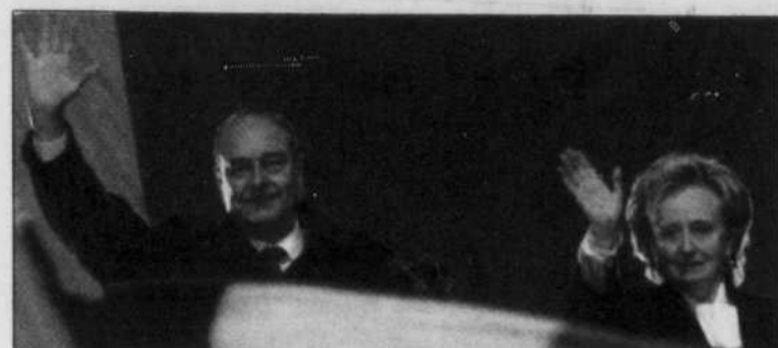
Jacques et Bernadette Chirac après la victoire.