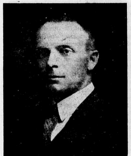
L'Honorable Godbout a triomphé de L'Honorable Bilodeau dans le comté de l'Islet par une majorité substantielle.