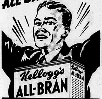
Fabriqué au Canada par Kellogg. Chez tous les épiciers.