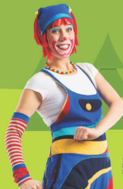
ATCHOUM porte-parole du Parc Mille Lieux

Parc extérieur animé pour les enfants de 2 à 8 ans.