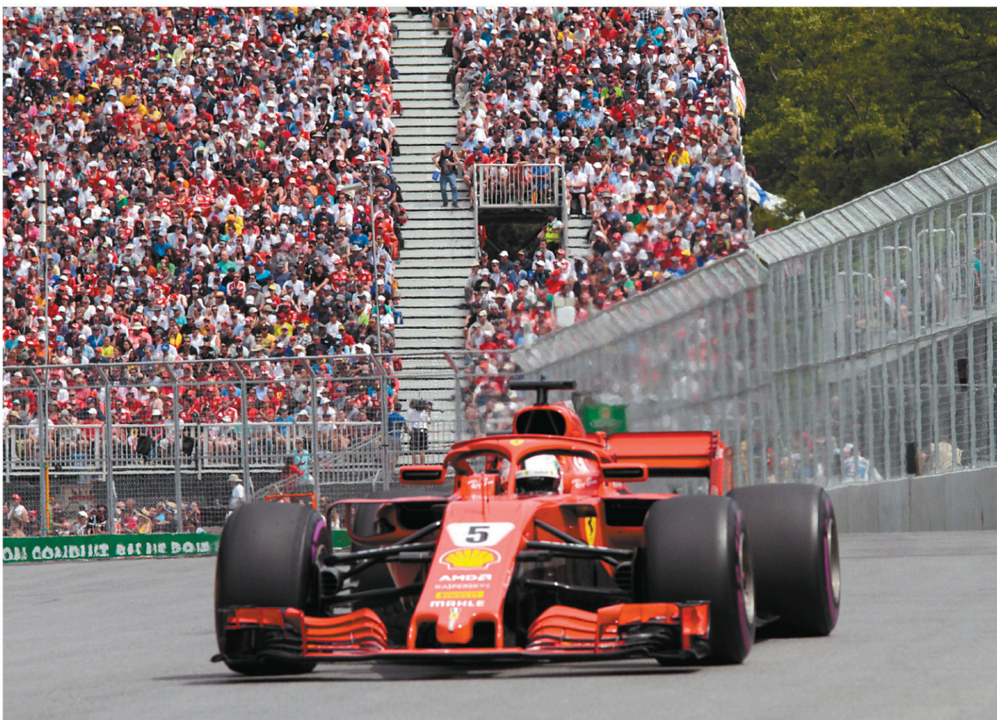
Sebastian Vettel a dit comprendre que des amateurs aient pu trouver que la course de dimanche manquait un peu d'action.