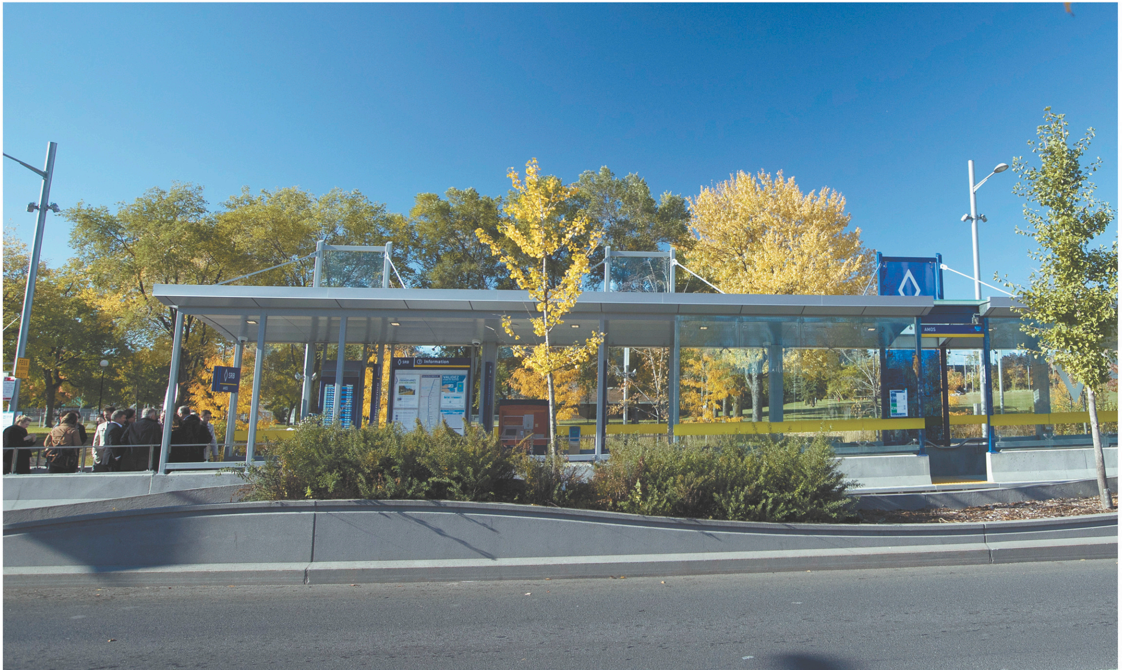
Le projet de l'axe Pie-IX prévoit pour le moment que 70 000 personnes emprunteront le SRB sur une base quotidienne à compter de sa mise en service en 2022.