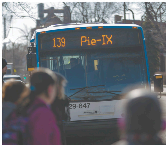
À l'heure actuelle, à peine une minute devrait s'écouler entre le passage de deux autobus.

« Il ne faut pas juste tenir compte du tracé et des rails, rajoute le chargé de cours. Il faut calculer les coûts d'exploitation, l'achat et le remplacement des véhicules, la construction des infrastructures, l'intérêt de l'emprunt du gouvernement... » Au bout de trente