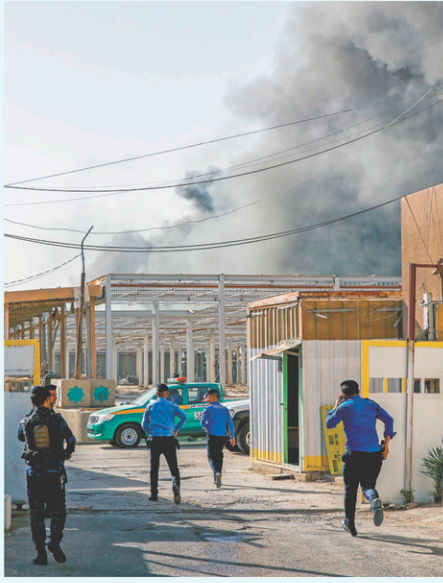
Après plusieurs heures, l'incendie qui s'est déclaré dans le dépôt des bulletins de vote de la plus grande circonscription d'Irak a été maîtrisé dans la soirée.