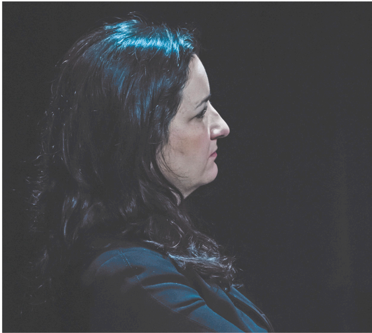
La ministre de la Culture, Marie Montpetit, rendra public mardi son document intitulé Partout, la culture .

Le gouvernement s'engagera aussi à parfaire ses connaissances des « conditions socioéconomiques des artistes et des travailleuses et travailleurs culturels », afin de mieux répondre à leurs besoins.