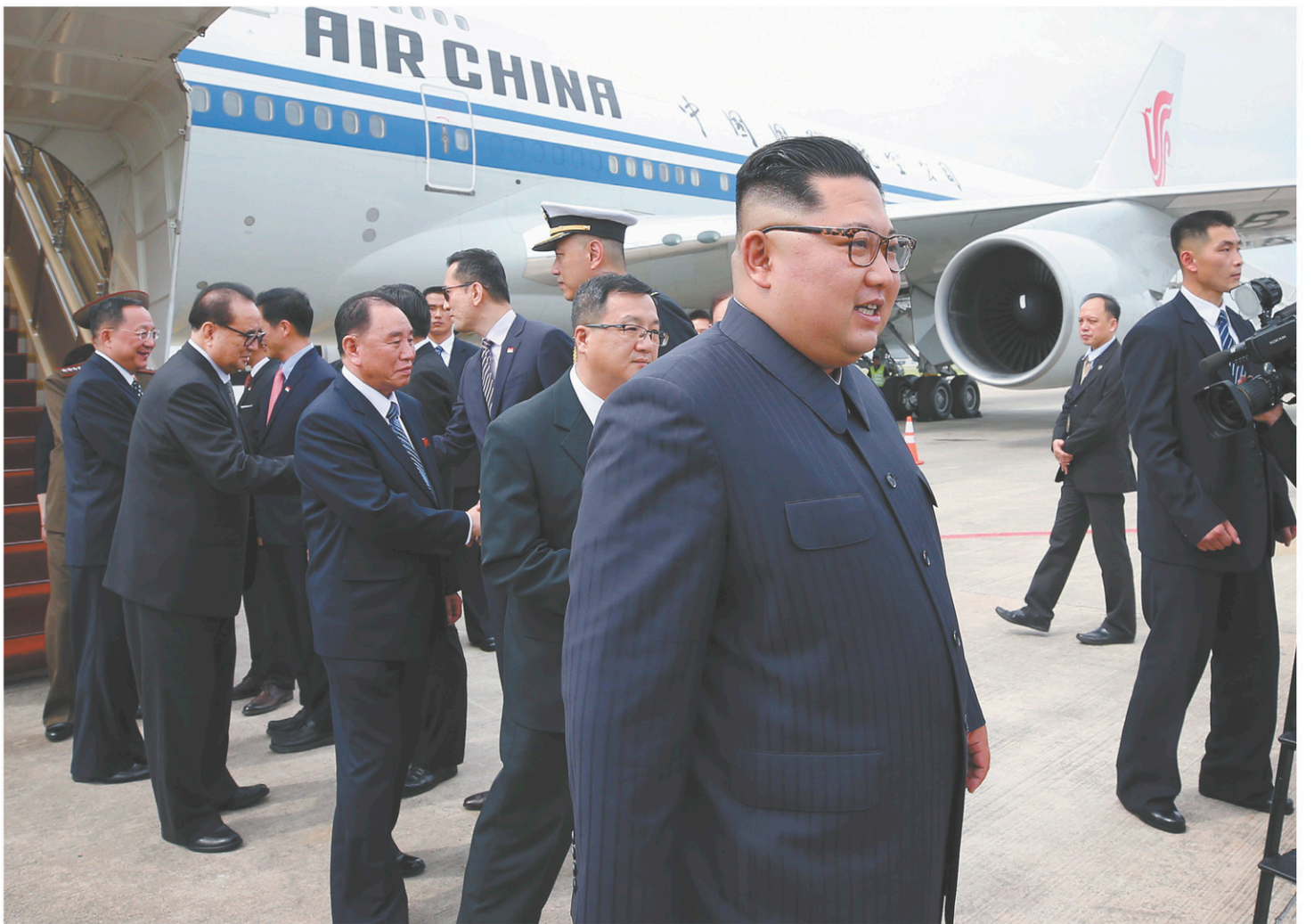
Kim Jong-un avait joué dans les airs au chat et à la souris avec les médias du monde entier qui traquaient son vol — pas moins de trois avions ont relié dimanche Pyongyang à la cité-État du Sud-Est asiatique.

FRANÇOIS BROUSSEAU EST CHRONIQUEUR D'INFORMATION INTERNATIONALE À ICI RADIO-CANADA. francobrousseau@hotmail.com