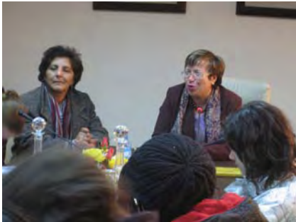
À droite, madame Nouzha Skalli, ministre du Développement social, de la Famille et de la Solidarité, reçoit le groupe d'étudiants.

L e Maroc, ce n'est pas simplement les dromadaires, les souks, les tajines et le sable. Le Maroc, c'est aussi une attention particulière aux moindres détails, un amour du travail bien fait. Ce qui surprend à première vue, c'est la beauté des monuments religieux et anciens. Mais au fond de chaque ruelle, chaque demeure, se trouve un trésor bien enfoui. La forme des portes, la couleur des murs, les gravures, les boiseries, le fer travaillé avec soin.