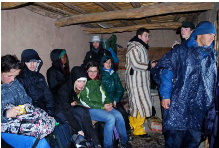
Le groupe d'étudiants dans un abri de montagne à l'est de Marrakech, en chemin pour une rencontre avec les sages des villages traditionnels du Haut-Atlas.