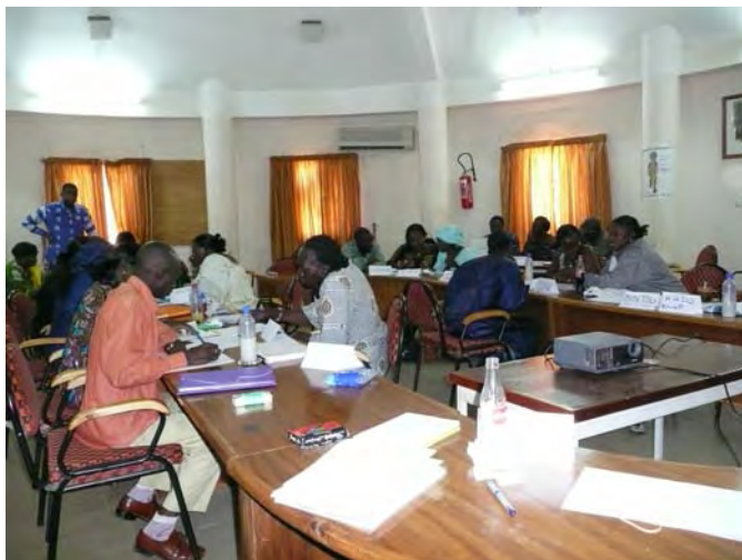
En plein travail.

A Ouagadougou, au Burkina Faso, en février 2009, dans le cadre du projet Formation Promotion Santé , une formation sur le suivi et l'évaluation d'un projet d'intervention est offerte à des formateurs travaillant dans le réseau de la santé (employés du ministère de la Santé, du ministère de l'Action sociale, d'associations, d'ONG et de l'École nationale de santé publique).