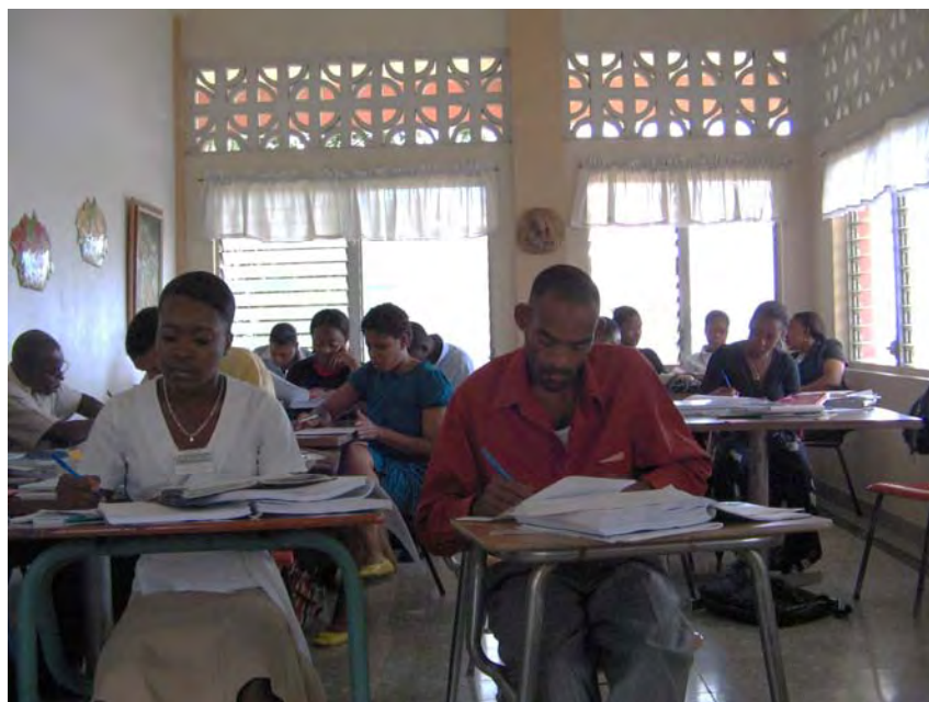
Séance de travail.

Nous avons aussi un rendez-vous avec la Fondation Connaissance et Liberté - FOKAL, fondation dirigée à l'époque par l'actuelle première ministre de la République d'Haïti, Mme Michèle Pierre-Louis. FOKAL a un programme Bibliothèque qui « vise à rendre le livre et la lecture plus accessible aux lecteurs haïtiens », tout particulièrement aux plus jeunes. Pour ce faire, FOKAL finance des bibliothèques dites « de proximité » et forme des animateurs de bibliothèque.