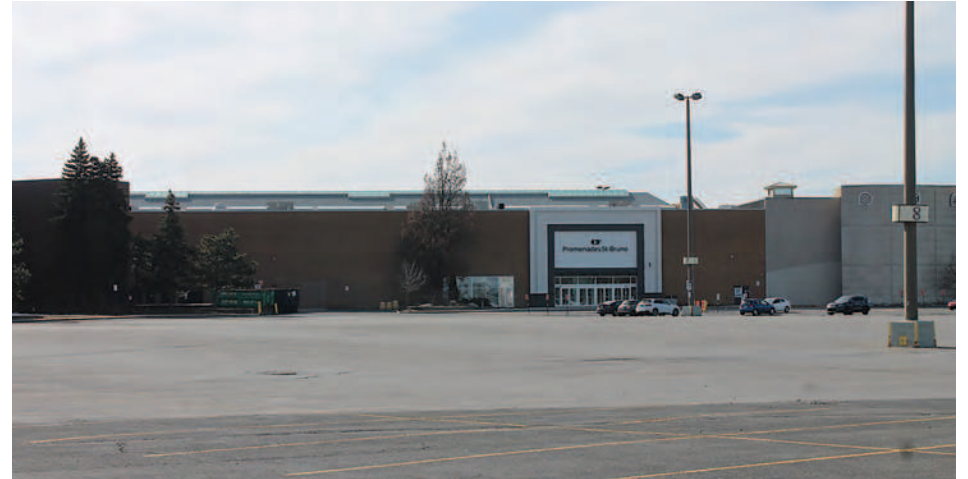
Les Promenades Saint-Bruno ont rouvert leurs portes.

Comme exigé par les autorités de la santé publique et les spécialistes en santé et sécurité du travail, des mesures de prévention ont été mises en place dans le contexte actuel de la pandémie de la COVID-19. Ces mesures incluent notamment un nombre limité de