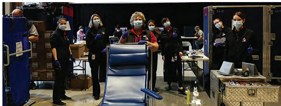
Des mesures de sécurité sont prises pendant la pandémie.

Ce sont 1 000 dons de sang qui sont nécessaires chaque jour afin de garantir un niveau de réserve optimal. C'est le cas en temps normal, comme en contexte de pandémie.