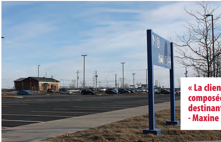
Le stationnement incitatif de Saint-Bruno-de-Montarville.

Enfin, mentionnons que seules 16 places régulières des 343 disponibles étaient occupées le 10 juin dans le stationnement incitatif de Saint-Basile-le-Grand. À ce nombre s'ajoutaient aussi cinq véhicules stationnés dans les cases réservées de Marchés Lambert et de Maxi, alors qu'une centaine de places sont disponibles. Ce jour-là, il y avait donc 21 des 444 cases occupées.