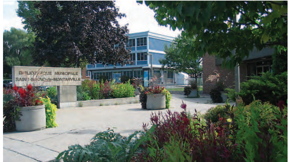
La bibliothèque de Saint-Bruno se déconfiner un peu plus.

tact ». Afin de permettre à ses abonnés de continuer ouverte du lundi au jeudi de 13 h à 21 h,