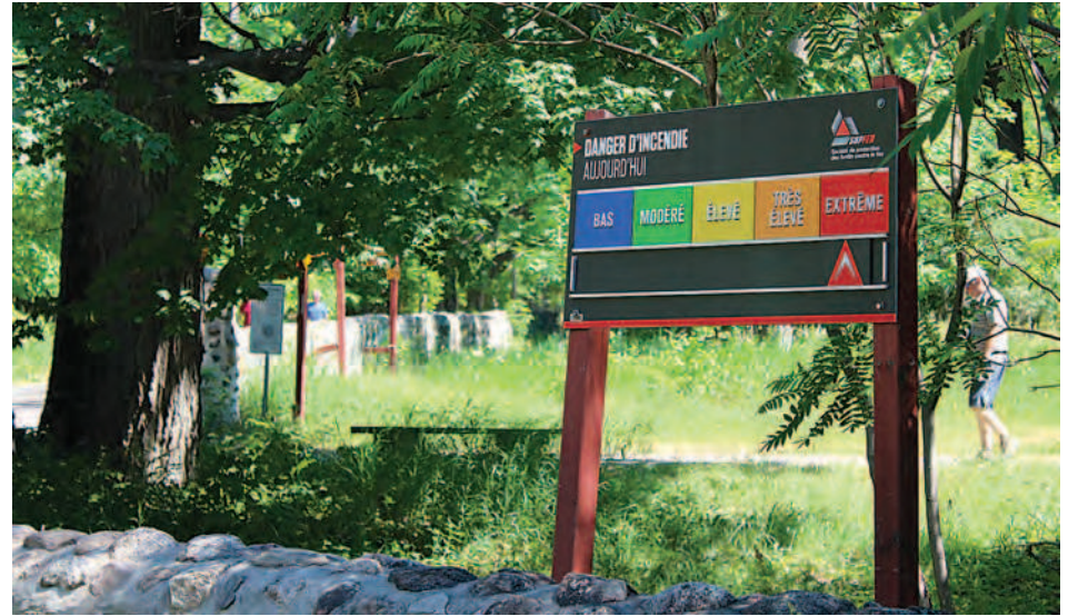
Les dangers d'incendie sont extrêmes au parc national du Mont-Saint-Bruno.

M. Landuydt indique que les risques d'incendie dans le parc national de Saint-Bruno sont paradoxalement plus importants la nuit, quand le parc est fermé. « Pendant la journée, nous avons un grand nombre de visiteurs qui nous alertent en cas de problème et les gardes de parc peuvent contrôler plus facilement les familles qui viennent pique-niquer dans les espaces qui y sont consacrés. La nuit, alors que le parc est fermé, la surveillance est plus com-