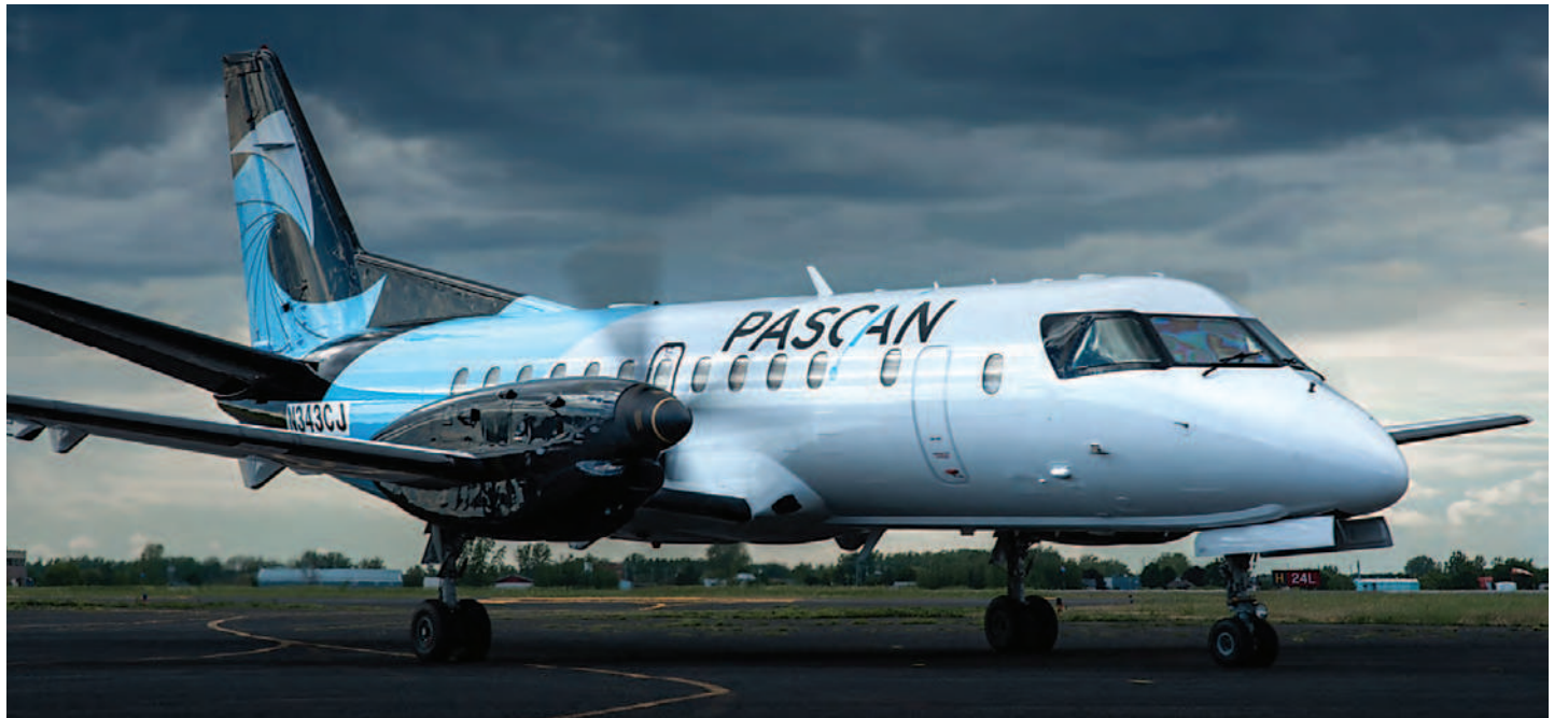
Pascan a reçu six nouveaux avions et en a six autres en option.