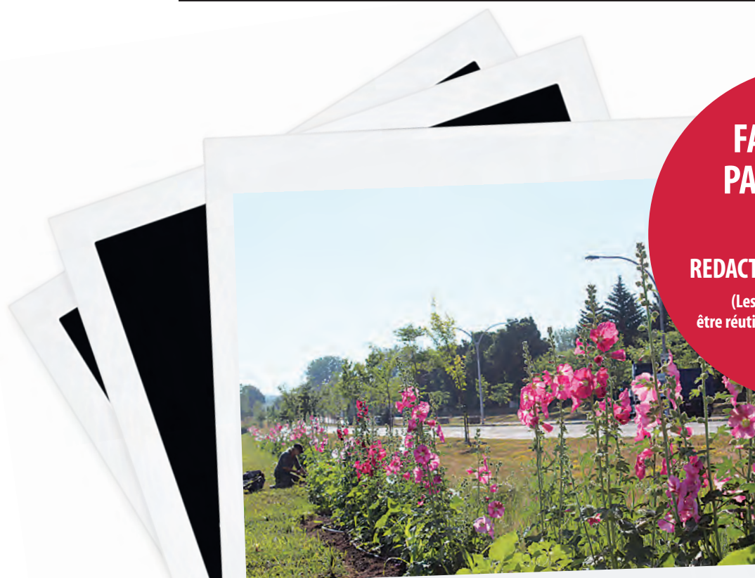
Élizabeth Ménard a profité de sa plantation de roses trémières, sur le bord de la Montée Montarville à Saint-Bruno, pour en faire un site de recueillement pour les aînés et les travailleurs de la santé qui n'ont pas survécu à la pandémie.

FAITES-NOUS PARVENIR VOS PHOTOS À REDACTION@VERSANTS.COM