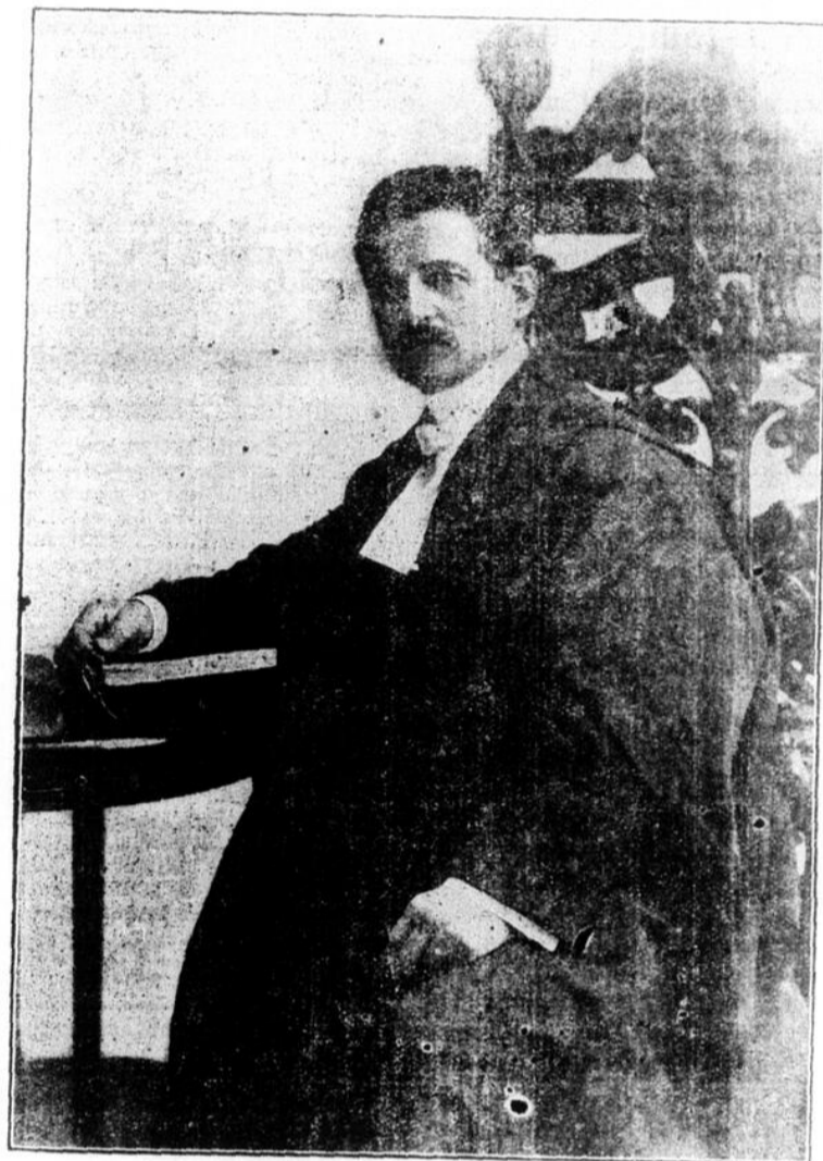
Seigneurie le juge Camille Pouliot, qui vient d'être honoré par l'Université Laval du titre si justement mérité de Docteur en Droit.

Galerie des journalistes, 16 janvier 1911.