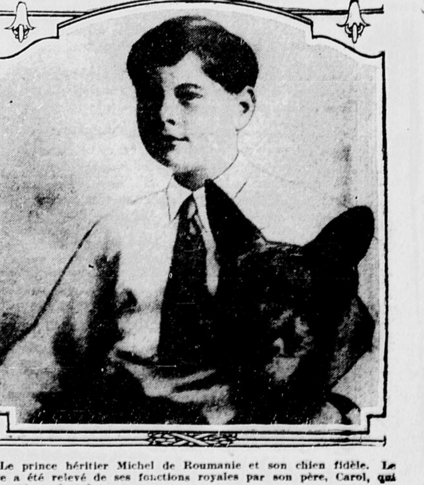
Le prince héritier Michel de Roumanie et son chien fidèle. Le prince a été relevé de ses fonctions royales par son père, Carol, qui est monté sur le trône.

Text reporting on the mining market and related news.