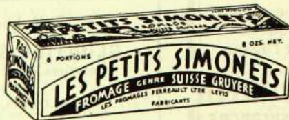
"LES PETITS SIMONETS"

que notre expert a voulu faire connaître par son nom si réputé dans le domaine de l'industrie fromagère.